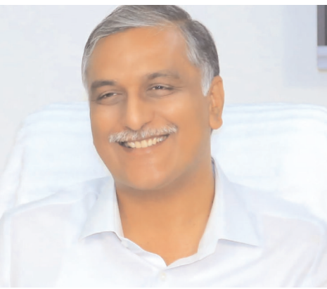
చెరువులు-బ్రిడ్జ్ పనులకు నిధుల మంజూరు

సిద్దిపేట రూరల్ , మార్చి 26 (ప్రజాజ్యోతి): సిద్దిపేట నియోజకవర్గంలో నీటి పారుదల అభివృద్ధికి మూడు కిలక పనులకు ఒక కోటి ఏడు లక్షల ఎనభై ఐదు వేల నిధులు మంజూరయ్యాయని మాజీ మంత్రి, ఎమ్మెల్యే హరీష్ రావు తెలిపారు. రాఘవాచార్- ఇంద్రగూడెం గ్రామాల్లో పల్లె కుంట, మొండి కుంట పునరుద్ధరణకు 48.20 లక్షలు, మిట్టపల్లి గుండ్ల చెరువు ఫీడర్ ఛానల్ వద్ద కొత్త బ్రిడ్జ్ నిర్మాణానికి 47.20 లక్షలు, ముంద్రాయి గ్రామంలోని మెరుపు కుంట శాశ్వత మరమ్మత్తుకు 12.45 లక్షలు మంజూరయ్యాయని తెలిపారు. రైతుల అభ్యర్థనల మేరకు ఈ పనులు ఆమోదించబడినట్లు పేర్కొంటూ, పనులను త్వరితగతిన ప్రారంభించి వేగంగా పూర్తి చేయాలని అధికారులను సూచించారు.