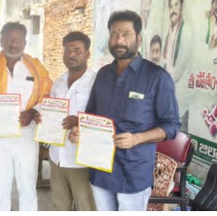
భాగస్వాములు కావాలని, ఏప్రిల్ (10, 11, 12, 13, 14, వరకు మహనీయుల, జ్ఞాన పాదయాత్రను తెలంగాణ పొలిటికల్ యువజన సమితి, ఆధ్వర్యంలో నిర్వహించడం జరుగుతుంది. కాపున యువత మేధావులు అందరూ కలిసి ఇట్టి కార్యక్రమం మాన్పి విజయవంతం చేసి యువత