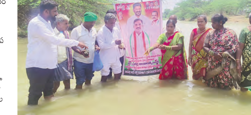
కాలువల ద్వారా అలేరు నియోజకవర్గాన్ని మూడు పువ్వులు ఆరుకాయలుగా పరిపాలన సాగిస్తున్న ప్రభుత్వ విప్ ఐలన్ను శతకోటి వందనాలు గ్రామస్థుల తరుపున తెలుపుతున్నామని వివరించారు. మాటలు చెప్పే నాయకులం కాదు పనులు చేసే నాయకులను ప్రజల తరుపున పోరాడే

నాయకులను అభివృద్ధి చేసే నాయకులను కోరుతున్నందుకు ప్రతి ఒక్కరికీ కృతజ్ఞతలు