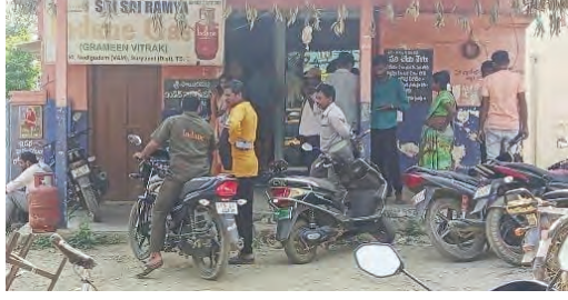
వినియోగదారులు గోడ్డూస వద్ద పడిగావులు కాస్తున్నారు. గ్యాస్ బుక్ చేసి 10 రోజులు గడుస్తున్నా ఓటీపీ రాకపోవడంతో తీవ్ర ఇబ్బందులు పడుతున్నారు. గ్యాస్ కొరత కారణంగా గంటల తరబడి లైన్ లో వేచి చూడాలి పనిలోని వినియోగదారులు ఆవేదన వ్యక్తం చేస్తున్నారు. ప్రభుత్వం స్పందించి గ్యాస్ సరఫరాను క్రమబద్ధీకరించాలని ప్రజలు కోరుతున్నారు.

నడిగూడెం, మార్చి 26, ప్రజా జ్యోతి: గతంలో యూరియా కోసం స్టోకెట్ కార్యాలయం వద్ద ఎదురుచూసిన అన్నదాతల తరహాలోనే, ఇప్పుడు గ్యాస్