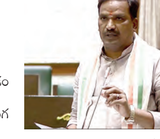
తమ సమస్యల పరిష్కారం కోసం కొద్దిరోజులు సమ్మె కూడా నిర్వహించారు. కాంగ్రెస్ పార్టీ ప్రభుత్వం

ఏర్పడిన తర్వాత తమ సమస్యలు పరిష్కార మవుతాయని అంగన్నాడి సిబ్బంది