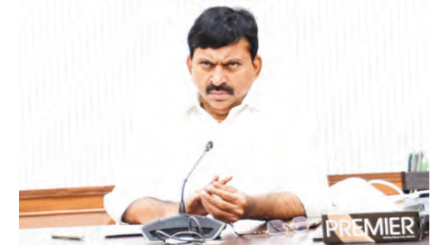
హైదరాబాద్, మార్చి 26 (ప్రజాజ్యోతి):