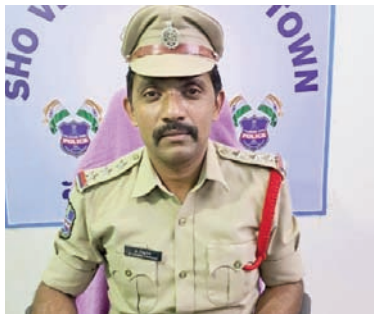
అవకాశాలు కానీ, ఉపాధి అవకాశాలకు పోలీస్ వెరైఫికేషన్ సమయంలో ఇబ్బందులు కలుగుతాయని, ట్రాఫిక్, రోడ్ భద్రత నియమ నిబంధనలను ఉల్లంఘిస్తే వారిపై చట్టపరమైన చర్యలు తీసుకుంటామని హెచ్చరించారు.

రాజు ఆధ్వర్యంలో కౌన్సిలింగ్ నిర్వహించి వారితో ఇంకెప్పుడు మద్యం సేవించి వాహనాలు నడవమని ప్రతిజ్ఞ చేపించారు. ఈ సందర్భంగా,సి.ఐ,మాట్లాడుతూ,ప్రతి రోజు పట్టణ పోలీస్ స్టేషన్ పరిధిలో డ్రంక్ అండ్ డ్రైవ్ తనిఖీలు, వాహన తనిఖీలు నిర్వహించాడం జరిగితుందని, మద్యం సేవించి వాహనం నడుపుతూ పట్టుబడిన వ్యక్తుల పై కఠిన చర్యలు తీసుకోవడం జరుగుతుందన్నారు. మద్యం సేవించి వాహనాలు నడుపుతూ పట్టుబడిన వారికి వారి తల్లితండ్రుల, లేదా కుటుంబ పెద్దల సమక్షంలో కౌన్సిలింగ్ ఇవ్వడం జరిగితుందని అన్నారు.మద్యం సేవించి వాహనాలు నడిపి పట్టుబడితే భవిష్యత్తులో వచ్చే ఉద్యోగ