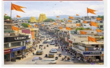
ఇంటి కప్పు పైన లేదా బాల్కనీలో కాషాయ జెండాను కడతారు. ఇది ఇంటికి ఒక పవిత్రమైన రూపాన్ని ఇస్తుంది. ధ్వజం కట్టేటప్పుడు జెండా శుభ్రంగా, చిరగకుండా ఉండాలి.సాధారణంగా దీనిపై 'ఓం' కారము లేదా హనుమంతుడి చిహ్నం ఉంటుంది. జెండాను ఎత్తిన ప్రదేశంలో గాలికి రెపరెపలాడేలా కట్టడం శుభప్రదంగా భావిస్తారు.