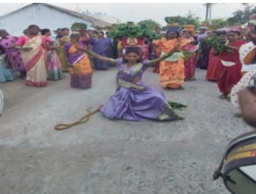
సుల్తానాబాద్, మార్చి 18: (ప్రజా జ్యోతి) మండలంలోని నారాయణపూర్ గ్రామంలో శ్రీ రేణుక ఎల్లమ్మ తల్లి ఆలయం వద్ద బోనాల

ఉత్సవాలు భక్తి శ్రద్ధల మధ్య ఘనంగా నిర్వహించారు. ఇటీవల నిర్మించిన ఆలయంలో నిర్వహించిన ఈ వేడుకల్లో అంబేద్కర్ కాలనీకి చెందిన మహిళలు, యువకులు పెద్ద సంఖ్యలో పాల్గొని అమ్మవారికి బోనాలు సమర్పించారు. ఈ సందర్భంగా డప్పు చప్పుళ్ల నడుమ భక్తులు ఊరేగింపుగా ఆలయానికి చేరుకున్నారు. సంప్రదాయ వేషధారణలో మహిళలు తలపై అలంకరించిన బోనాలు మోసుకుంటూ ఆలయానికి చేరుకోవడం ఆకట్టుకుంది. ఊరంతా పండుగ వాతావరణంలో మునిగిపోయి, భక్తి పరవశంతో