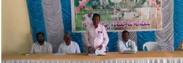
బీకాబాద్ మార్చి 26 ప్రజా జ్యోతి బీకాబాద్ మండలం కేంద్రంలో నవాంబ్రి

సొసైటీ ద్వారా మినీ ఫంక్షన్ హాల్ ఏర్పాటు చేస్తాం పిబిసి రామచంద్రావు