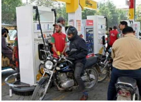
నిలబడుతున్నా.. కేవలం పుకార్లు నమ్మొద్దు అని ప్రకటనలు విడుదల చేయడం వల్ల ప్రయోజనం శూన్యం.

శేరిలింగంపల్లి, మార్చి 26 (ప్రజాజ్యోతి): హైదరాబాద్ నగరంలో పెట్రోల్ బంకుల వద్ద కనిపిస్తున్న కిలోమీటర్ల కొద్దీ క్యూలు కనిపిస్తున్నాయి. రోజంతా ఆ రద్దీ ఉంటుంది. పోలీసులు సైతం క్యూలను కంట్రోల్ చేయడానికి రంగంలోకి దిగాల్సి వచ్చింది. దీంతో అసలు పెట్రోల్ కొరత లేదని అధికార యంత్రాంగం ప్రకటనలు చేస్తోంది. అయితే ప్రజల ఆందోళన కేవలం పుకార్ల వల్ల వచ్చిందని సరిపెట్టుకోవడం బాధ్యతారాహిత్యమే అవుతుంది. శ్రీలంక, పాకిస్తాన్ వంటి దేశాలు ఆర్థిక సంక్షోభంలో ఉన్నప్పుడు, రష్యా-ఉక్రెయిన్ యుద్ధం జరుగుతున్నప్పుడు కూడా మన దగ్గర కనిపించని పానిక్ బయింగ్ ఇప్పుడు ఎందుకు మొదలైందో నిర్ణయాలు తీసుకునేవాళ్లు ఆలోచించాలి. స్టాక్ ఉందని మాటల్లో చెప్పడం కంటే, బంకుల్లో స్టాక్ బోర్డులు మాయమై పెట్రోల్ దొరుకుతుందనే నమ్మకాన్ని కలిగించడంలో యంత్రాంగం విఫలమైంది. ముందస్తు చెల్లింపుల ముప్పు పెట్రోల్ బంకుల మాత్రం అసలు కారణం అయిలే కంపెనీలు అంతర్గతంగా తీసుకున్న ఒక వింత నిర్ణయమని తెలుస్తోంది. గతంలో ఇంధనం సరఫరా అయిన రెండు మూడు రోజుల తర్వాత చెల్లింపులు చేసే వెసులుబాటు బంకులకు ఉండేది. కానీ, ఇప్పుడు ముందు డబ్బు కడితేనే స్టాక్ అనే నిబంధనను కఠినతరం చేయడంతో చిన్న బంకులు నగదు సర్దుబాటు చేసుకోలేక చేతులెత్తేశాయి. ఇలాంటి సున్నితమైన సమయంలో, క్షేత్రస్థాయి పరిస్థితులు అర్థం చేసుకోకుండా బుర్ర ఉన్నవారెవరైనా ఇటువంటి నిర్ణయం తీసుకుంటారా అనేది ఎవరికైనా వచ్చే సందేహం. బంకులు మూసేస్తే ఆటోమేటిక్ గా పానిక్ రాక ఏమీ వస్తుంది.