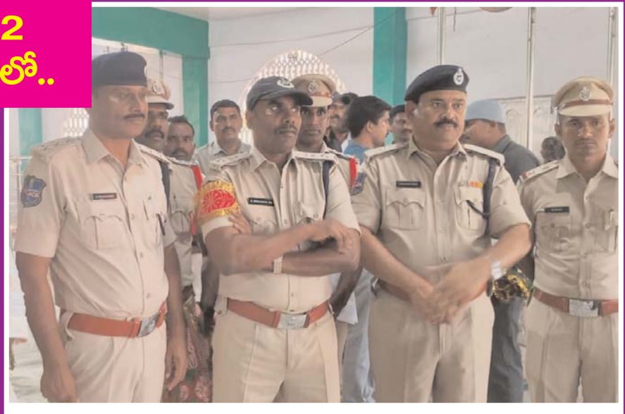
జానపహాద్ దర్గా ఉర్సు ఉత్సవానికి పట్టిష్ట భద్రత