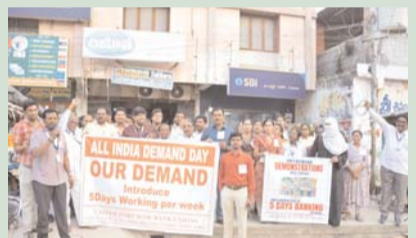
మిర్యాలగూడ, జనవరి 22, (

5 రోజుల పని దినాలు అమలు చేయాలంటూ బ్యాంకు ఉద్యోగుల ధర్మా