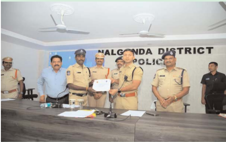
జిల్లా పోలీస్ శాఖకు చెందిన సైబర్ వారియర్ పోలీస్ కానిస్టేబుకు

సైబర్ నేరాల నియంత్రణలో పాటు ప్రజలకు సైబర్ అవగాహన కల్పించడం లో ఉత్తమ సేవలు అందించిన నల్లగొండ జిల్లా సైబర్ వారియర్స్ కు రాష్ట్ర స్థాయిలో గుర్తింపు లభించింది. నల్లగొండ