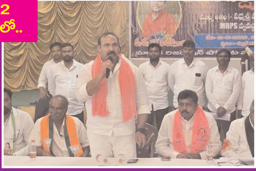
నన్ను రాజకీయంగా బలి చేయడానికే కర్ణ రాజేష్ మరణం