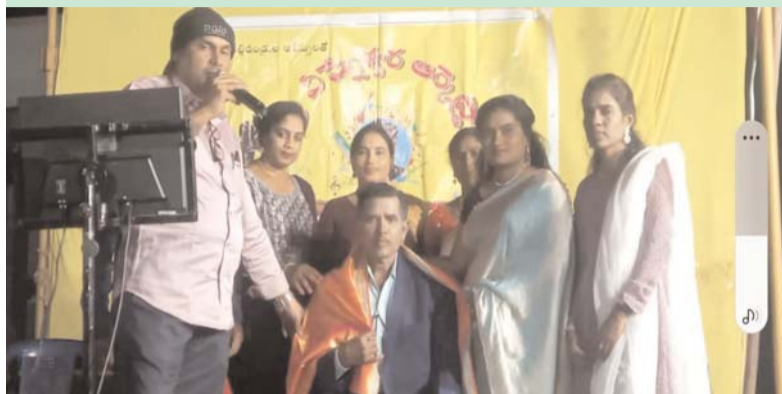
నాగార్జునసాగర్ జనవరి 21 ప్రజా జ్యోతి

ఎన్టీ రామారావు పద్ధతి సందర్భంగా కళాకారుల కవేరి అలనాటి పాటలకు వేదిక