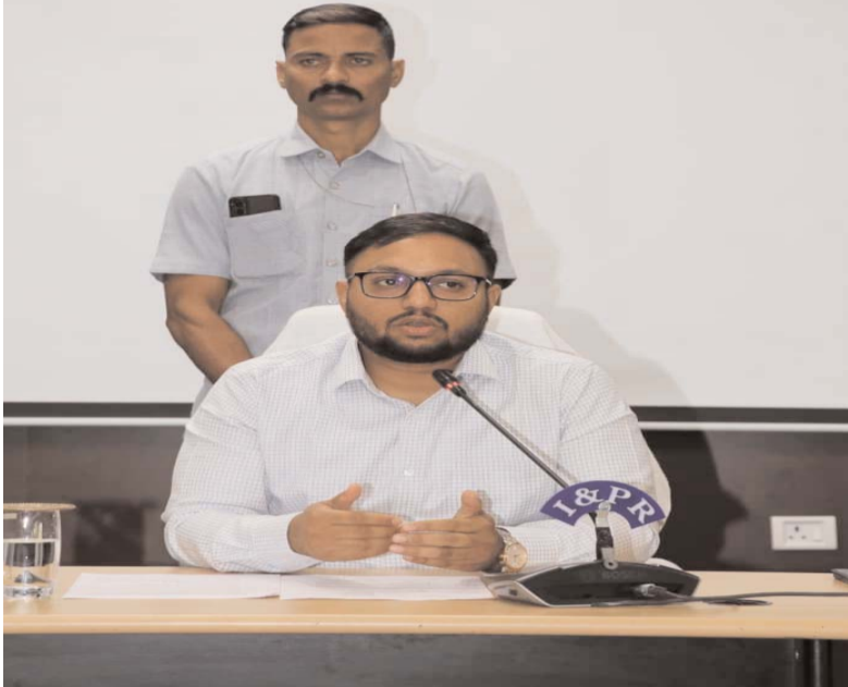
సూర్యాపేట జిల్లా ప్రతినిధి జనవరి 21(ప్రజాజ్యోతి)