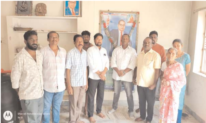
కోదాడ టౌన్, జనవరి 21 (ప్రజా జ్యోతి):