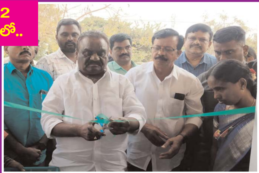
విద్య-వైద్యానికి రేవంత్ రెడ్డి సర్కార్ ప్రాధాన్యత