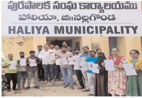
పురపాలక సంఘ కార్యాలయము హాలియా, జి.నల్లగొండ HALIYA MUNICIPALITY

సంఘాల ఎన్నికలను నిర్వహించడకుండా పట్టణ ప్రాంతాల్లో మున్సిపల్ ఎన్నికలు నిర్వహిస్తున్నారని ఎద్దేవా చేశారు. రాష్ట్రం లో ఎప్పుడూ ఏ ఎన్నికలు వచ్చినా కాంగ్రెస్ పార్టీకి బుద్ధి చెప్పడానికి ప్రజలు సిద్ధంగా ఉన్నారని స్పష్టం చేశారు. హామీల అమలుకు చేతకాని కాంగ్రెస్ పార్టీది మాటల ప్రభుత్వమైతే, గత పదేళ్లుగా అన్ని వర్గాలను ఆదుకుంటూ అభివృద్ధి చేసిన బీఆర్ఎస్ ప్రభుత్వమే చేతల ప్రభుత్వమని కొనియాడారు. రాజకీయ జీవితంలో గెలుపోటములు సహజమని, ఓటమికి కృంగిపోవద్దని, ఓటములు లేకుండా విజయాలు సాధ్యం కాదని అన్నారు. స్థానిక సంస్థల ఎన్నికల్లో ఓడిపోయిన బీఆర్ఎస్ పార్టీ అభ్యర్థులకు పార్టీ అన్ని విధాలా అండగా ఉంటుందని భరోసా ఇచ్చారు. స్థానిక సంస్థల ఎన్నికల్లో కష్టపడ్డ ప్రతి ఒక్కరికీ ధన్యవాదాలు తెలుపుతూ, ఇదే స్ఫూర్తితో రాబోయే ప్రతి ఎన్నికలో గులాబీ జెండా ఎగరేలా కార్యకర్తలు, నాయకులు, ప్రజలు సిద్ధంగా ఉండాలని పిలుపునిచ్చారు.