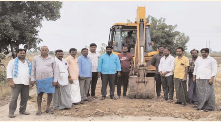
పెద్దవూర జనవరి 12 (ప్రజా జ్యోతి)