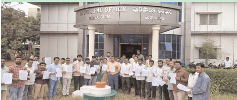
మిర్యాలగూడ, జనవరి 12, ( ప్రజాజ్యోతి ):