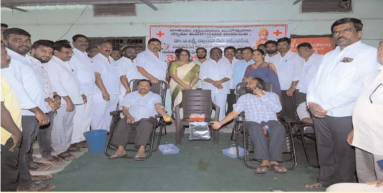
మోతూర్ జనవరి 12 (ప్రజా జ్యోతి)