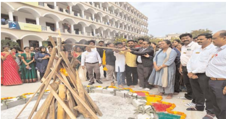
భూదాన్ పోచంపల్లి, జనవరి 12 (ప్రజాజ్యోతి)