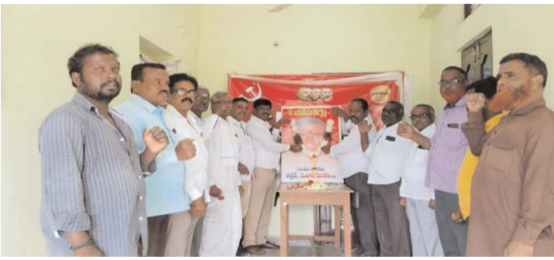
ఆలేరు జనవరి 12 (ప్రజా జ్యోతి)