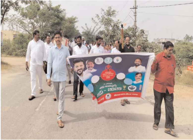
గుండాల, జనవరి 12 (ప్రజా జ్యోతి):