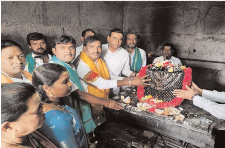
ఆలేరు జనవరి 12 (ప్రజా జ్యోతి)