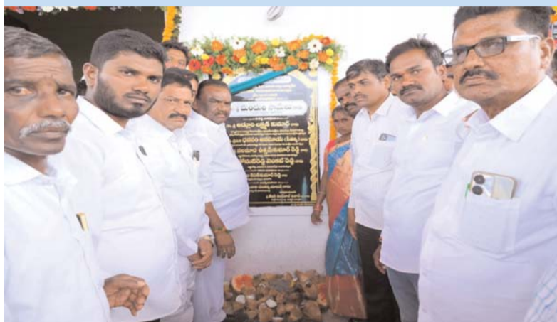
నాగారం జనపరి 12 ప్రజా జ్యోతి.