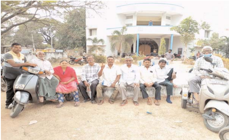
హుజూర్ నగర్ జనవరి 12 (ప్రజా జ్యోతి)