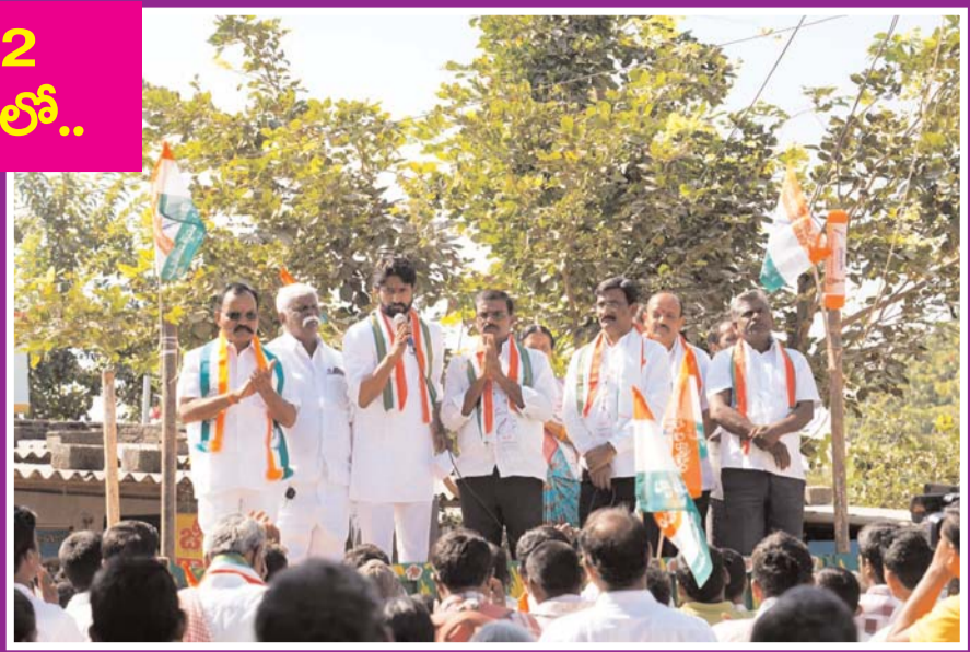
గ్రామ ప్రగతే కాంగ్రెస్ పార్టీ ధ్యేయం