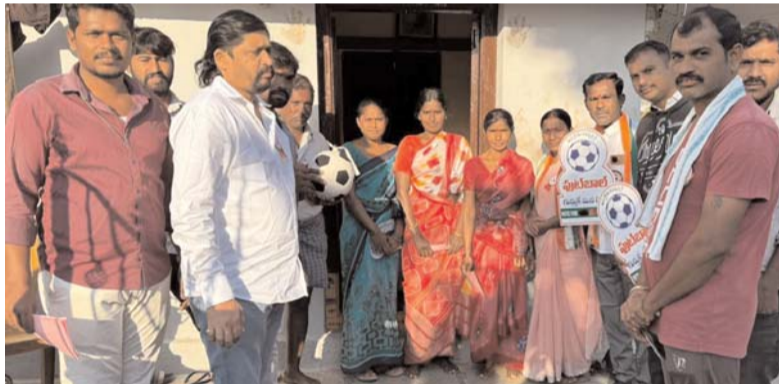
అలేరు డిసెంబర్ 12 ప్రజా జ్యోతి

కాంగ్రెస్ పార్టీ సర్పంచ్ అభ్యర్థి మంత్రి లతా స్వామి