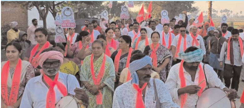
మిర్యాలగూడ, డిసెంబర్ 12, ( ప్రజాజ్యోతి )

సుడిగాలి పర్యటనలతో అధికార,విపక్ష నాయకులు