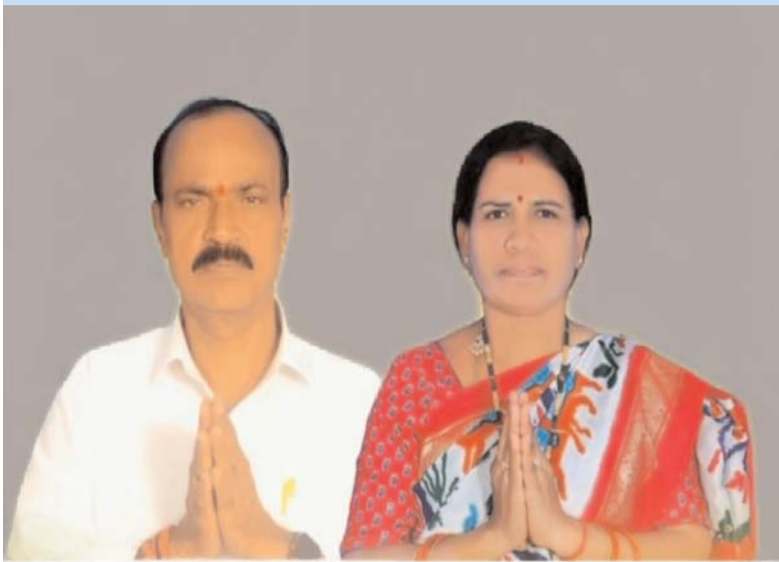
మునుగోడు డిసెంబర్, 12 (ప్రజా జ్యోతి):