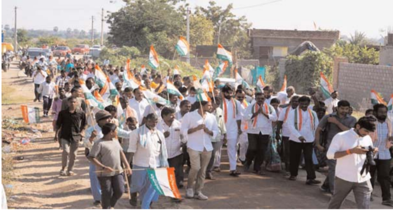
హాలియా, డిసెంబర్ 12 (ప్రజా జ్యోతి)