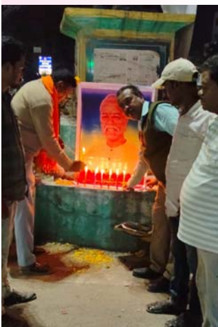
ధర్మారం,నవంబర్ 16(ప్రజా జ్యోతి స్వాస్):

ప్రముఖ గాయకుడు అందెశ్రీకు ధర్మారం మండలంలో స్థానిక అంబేద్కర్ చౌరస్తాలో నాయకులు చిత్రపటానికి పూలమాలలు వేసి,కొవ్వొత్తులతో శ్రద్ధాంజలి ఘటించారు. ఈ సందర్భంగా వారు మాట్లాడుతూ తెలుగు ప్రజాసాంస్కృతిక వైభవాన్ని తన గానంతో ప్రతిధ్వనింపజేసిన ప్రముఖ ప్రజాగాయకుడు అందెశ్రీ అని అన్నారు. 'అందెశ్రీ గారి స్వరంలో