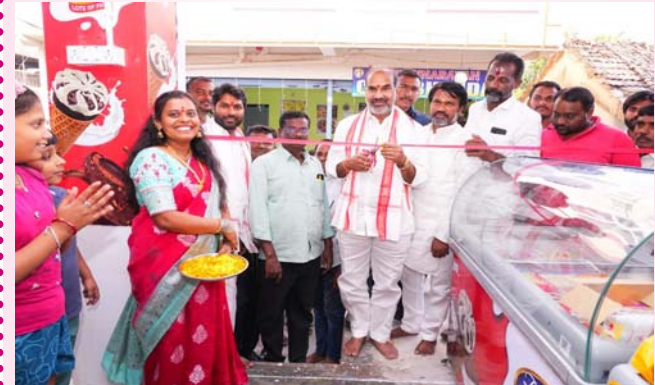
వేములవాడ, నవంబర్ 16, (ప్రజాజ్యోతి):

ప్రజల ఆదరణ పొందాలి - ప్రభుత్వ విప్ ఆది శ్రీనివాస్