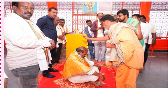
వేములవాడ, నవంబర్ 16, (ప్రజాజ్యోతి):