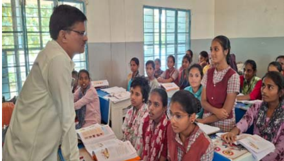
ఉపాధ్యాయులు సిబ్బంది పాల్గొన్నారు.

మేడిపల్లి నవంబర్ 16 (ప్రజా జ్యోతి ) మండల కేంద్రంలోని కస్తూర్బా గాంధీ పాఠశాలను ఆదివారం రోజు ఆకస్మికంగా తనికీ చేసిన జిల్లా విద్యాధికారి పదవ తరగతి విద్యార్థులకు ముఖ్యమైన సూచనలు ఇచ్చారు. పరీక్షల కోసం ఏ విధంగా చదవాలి సూచనలు ఇచ్చారు. స్టోర్ రూమ్, కిచెన్ లో నిల్వ ఉంచిన సన్న బియ్యం ఇతర సరుకుల నాణ్యతను తనికీ చేశారు. మెనూ ప్రకారం ఉడకబెట్టిన కోడి గుడ్డను నిర్మిత రోజుల్లో మాంసాహారం, అరటి పండ్లు అందిస్తున్నారా అని పిల్లలను అడిగి తెలుసుకున్నారు. రాజోయే పదవ తరగతి పరీక్షలో వందకు వంద శాతం ఉత్తీర్ణత సాధించాలని కోరారు.