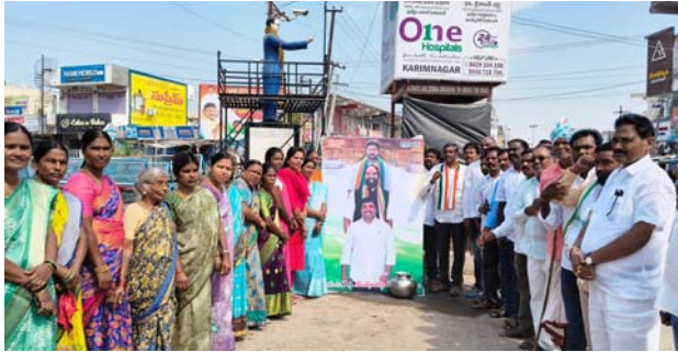
గంగాధర ప్రతినిధి నవంబర్ 16:(ప్రజా జ్యోతి)