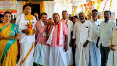
జగిత్యాల టౌన్, నవంబర్ 16, ప్రజాజ్యోతి