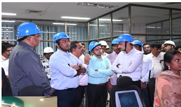
గణపురం ప్రజాజ్యోతి నవంబర్ 11:

రాష్ట్ర ఇంధన శాఖ ప్రిన్సిపల్ సెక్రటరీ నవీన్ మిట్టల్-కేటిపిపి లో అన్ని విభాగాల పరిశీలన ప్లాంట్ల నిర్వహణపై సంతృప్తి డి ఏవి పాఠశాలలో బాస్కెట్ బాల్ కోర్సు ప్రారంభోత్సవం