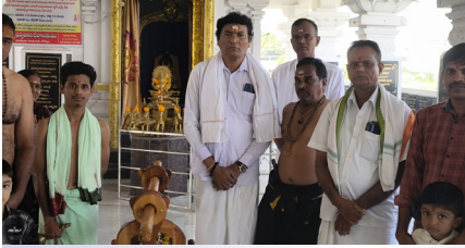
జగిత్యాల టౌన్, నవంబర్ 09, ప్రజాజ్యోతి: జగిత్యాల పట్టణములోని చింత కుంట చెరువు సమీపంలో కొలువై ఉన్న శ్రీ సూర్య ధన్వంతరి