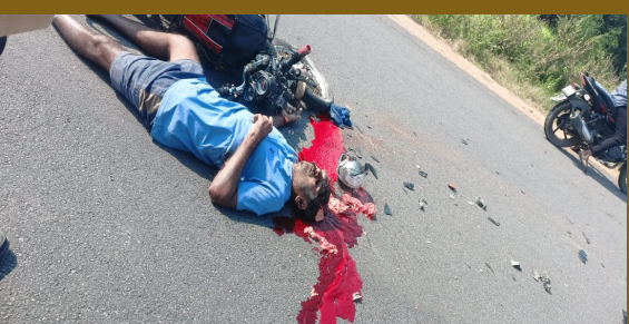
భీమదేవరపల్లి: నవంబర్ 9 (ప్రజా జ్యోతి): టిప్పర్, ద్విచక్ర వాహనం ఢీకొని మృతి చెందిన ఘటన