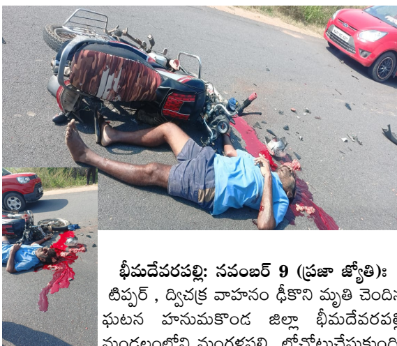
భీమదేవరపల్లి: నవంబర్ 9 (ప్రజా జ్యోతి): టిప్పర్ , ద్వీచక్ర వాహనం ఢీకొని మృతి చెందిన ఘటన హనుమకొండ జిల్లా భీమదేవరపల్లి మండలంలోని మంగళపల్లి లోచోటుచేసుకుంది.

-ఇద్దరు చిన్నారులకు గాయాలు - ప్రమాదాలపై స్థానికులు ఆందోళన