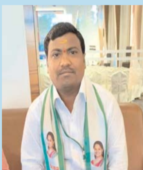
వాంకిడి, ఆగస్టు 26 ( ప్రజాజ్యోతి)

కుంఠాభీమ్ ఆసిఫాబాద్ జిల్లా వాంకిడి మండలం తెలంగాణ జాగృతి వ్యవస్థాపకురాలు కల్వకుంట్ల కవిత ఆదేశాల మేరకు, వాంకిడి మండల కేంద్రంలోని హనుమాన్ మందిర్ వద్ద ఈరోజు ఉదయం 10 గంటలకు మట్టి గణపతుల పంపిణీ కార్యక్రమం జరగనుంది. ఈ సందర్భంగా, వాంకిడి మండల భక్త మహాశయులందరూ మట్టి గణపతులను తీసుకుని పూజించాలని కోరారు. పార్వతీదేవి మేని నలుగు మట్టి నుంచే అసలు గణపతి పుట్టాడని, అందుకే మట్టితోనే విగ్రహాన్ని పూజించడం వల్ల భక్తి, ముక్తి, శక్తి లభిస్తాయని, వినాయక చవితి పండగ ప్రకృతితో మమేకం అయి ఉందని తెలియజేస్తూ, అందరూ మట్టి గణపతులతో పూజించాలని పిలుపునిచ్చారు.