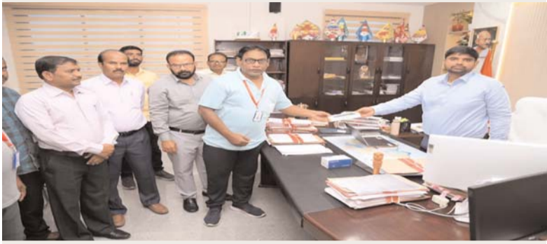
మంచుర్యాల ప్రతినిధి ఆగస్టు 26 ప్రజా జ్యోతి: