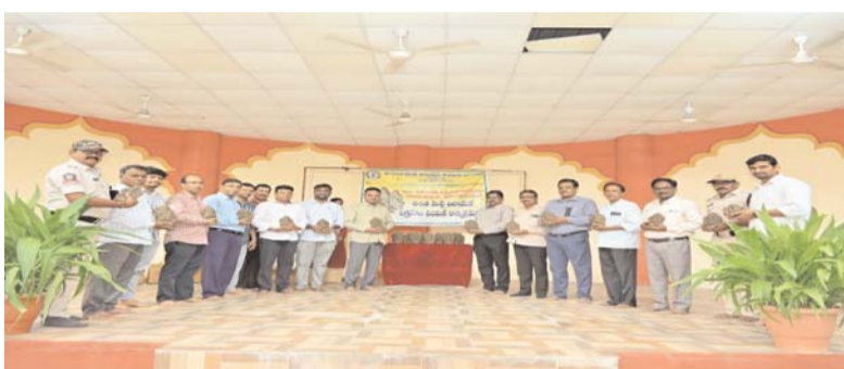
మంచురాల, 26, ఆగస్టు, ( ప్రజాజ్యోతి ):

జి.ఎం.కార్యాలయం, సేవా భవన్ లలో మట్టి వినాయక విగ్రహాల పంపిణీ