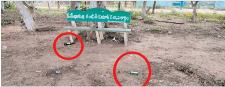
కోల్ బెట్ (ఆర్వేపీ) ఆగస్టు 26 (ప్రజా జ్యోతి):

మందమర్రి ఏరియా రామకృష్ణాపూర్ రాగూర్ స్టేడియం మందు బాబులకు అడ్డగా మారింది. ఆరోగ్యం, మానసికంగానికి క్రీడలు, వాకింగ్, వ్యాయామం, యోగా చేయడానికి ప్రతి రోజు ఉదయం సాయంత్రం రాగూర్ స్టేడియంకు వచ్చే వారికి ఎక్కడ చూసిన మధ్యం సీసాలు దర్శనమిస్తున్నాయి. కోల్ ఇండియా, రాష్ట్ర జిల్లా స్టాయి క్రీడా పోటీలకు వేదిక అయిన రాగూర్ స్టేడియం ఇప్పుడు సింగరేణి అధికారుల పర్యవేక్షణ కరువయ్యింది. మధ్యం ప్రియులకు అడ్డగా మారిన రాగూర్ స్టేడియంపై సింగరేణి అధికారులు, పోలీసులు ప్రత్యేక దృష్టి పెట్టి ఇలాంటి సంఘటనలు పునరావృతం కాకుండా చూడాలని వాకర్లు క్రీడాకారులు స్థానికులు కోరుకుంటున్నారు.