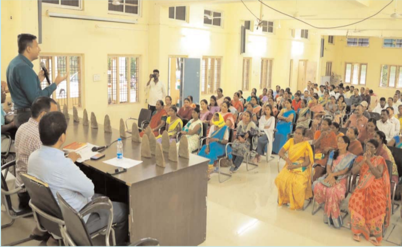
సంక్షేమ శా ఖ సిబ్బంది, కాలుష్య నియం త్రణ బోర్డు సమన్వయ కర్తలు పాల్గొని విజయవంతం చేశారు.