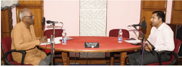
జిల్లా కలెక్టర్ రాజర్షి షా

ఆదిలాబాద్ బ్యూరో జూన్ 24 (ప్రజా జ్యోతి): మత్తు పదార్థ రహిత సమాజ ఏర్పాటు కోసం బహుముఖ వ్యూహంతో కార్యాచరణను చేపట్టినట్లు ఆదిలాబాద్ జిల్లా కలెక్టర్ రాజర్షి షా వెల్లడించారు. అంతర్జాతీయ మాదక ద్రవ్యాల దుర్వినియోగం, అక్రమ రవాణా వ్యతిరేక దినోత్సవ వారోత్సవాలలో భాగంగా మంగళవారం జిల్లా కలెక్టర్ రాజర్షి షా మాదక ద్రవ్యాల దుర్వినియోగం అక్రమ రవాణాను అరికట్టడంతోపాటు వాటి వాడకం వల్ల కలిగే దుష్పరిణామల గురించి ప్రజల్లో చైతన్యం తీసుకు రావడం కోసం చేపడుతున్న కార్యక్రమాల గురించి వివరించారు. అవగాహన, చైతన్యం తోనే వీటిని రూపు మాప గలుగుతామని పేర్కొన్నారు. ఎక్కువగా యువకులు ఈ మత్తు పదార్థాల వైపు ఆకర్షితులై తమ భవిష్యత్తును నాశనం చేసుకుంటున్నారని అన్నారు. మొదట ఆనందం, సరదాగా వాటి పట్ల ఆకర్షితులై ప్రకంగా వాటికి బానిసలై వారి భవిష్యత్తు దుర్భరం చేసుకుంటున్నారని అన్నారు. అందుకే వీటి వల్ల కలిగే అనర్థాలపై అవగాహన కల్పించడంతో పాటు, వీటిని అరికట్టడం కోసం ప్రత్యేకంగా ప్రభుత్వం మిషన్ పరివర్తన కార్యక్రమాన్ని చేపట్టినట్లు తెలిపారు. పాఠశాలలు, కళాశాలల్లో యాంటి డ్రగ్స్