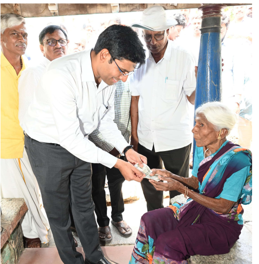
మాట్లాడి పెన్షన్లను సచివాలయం సిబ్బంది లబ్ధిదారుల ఇంటి