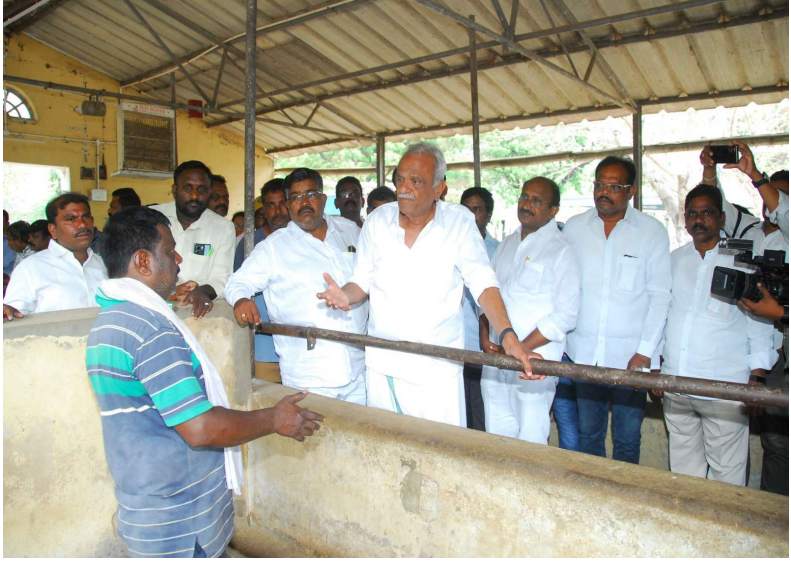
గోశాలలో పశువుల నిర్వహణ సక్రమంగానే ఉంది... సీపీఐ జాతీయ కార్యదర్శి కె.నారాయణ హితవు...

ఏప్రిల్ 16, (ప్రజాజ్యోతి), తిరుపతి జిల్లా ప్రతినధి : ప్రపంచ ప్రఖ్యాత ధార్మిక సంస్థపై ప్రజలు ఎంతో విశ్వాసంతో ఉంటారని, అదే తీరున బూరిజం కూడా అభివృద్ధి చెందుతున్న ప్రాంతంలో రాజకీయాలు చేయడం తగదని వివిధ రాజకీయ పార్టీలకు సీపీఐ జాతీయ కార్యదర్శి కె.నారాయణ హితవు పలికారు. గత నాలుగు రోజులుగా ఢిల్లీలో ఆధ్వర్యంలో నిర్వహించబడుతున్న ఎన్సీ గోశాలలో గోవుల మృత్యువాత పడడంపై వస్తున్న ఆరోపణల దృష్ట్యా బుధవారం ఆయన ఎన్సీ గోశాలను సందర్శించారు. అక్కడ గోశాల నిర్వహణ, గోవులకు అందిస్తున్న దాణా, మేత, డ్రైరి నిర్వహణ తీరును స్థానిక సీపీఐ నాయకులతో కలిసి పరిశీలించారు. ఎన్సీ గోశాలలోని వివిధ రకాల పశువులు, వాటి ఆహారం, సంరక్షణ వివరాలను ఆరాటేశారు. అక్కడ