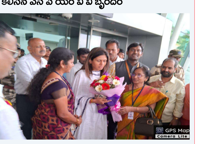
ఏప్రిల్ 16, (ప్రజాజ్యోతి), తిరుపతి జిల్లా ప్రతినధి