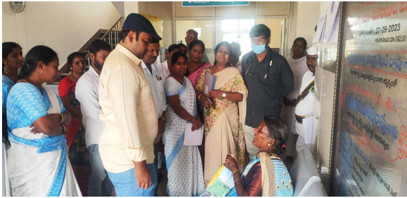
మెదక్ (ప్రజాజ్యోతి) 01, ఏప్రిల్