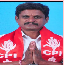
కుత్బుల్లాపూర్ ఏప్రిల్ 1(ప్రజా జ్యోతి)

హైదరాబాద్ సెంట్రల్ యూనివర్సిటీ లోని దాదాపు 400 ఎకరాల భూమిని చవక ధరకు ప్రవేటు వ్యక్తులకు అమ్మడం భారత కమ్యూనిస్ట్ పార్టీ పూర్తి వెతిరేకిస్తుంది అని ఈ విధానని ఖండిస్తున్నట్లు ఒక ప్రకటనలో వారు తెలిపారు.