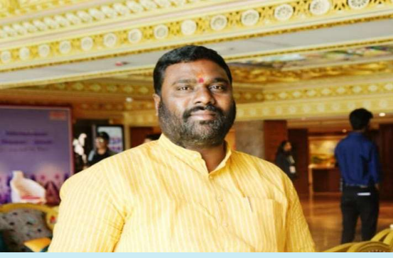
కల్వకుర్తి, ఏప్రిల్ 1 (ప్రజా జ్యోతి):