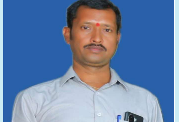
అబ్దుల్లాపూర్ మెట్టు ఏప్రిల్ 01(ప్రజా జ్యోతి)