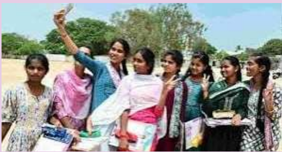
నర్స ఏప్రిల్ 02 ప్రజా జ్యోతి :