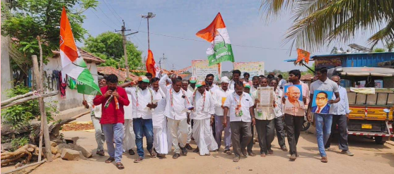
కల్వర్. 2. ఏప్రిల్ ప్రజా జ్యోతి

- కాంగ్రెస్ పార్టీ అధ్యక్షులు బొరుగుల పోచయ్య