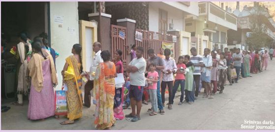
అబ్దుల్లాపూర్ మెట్టు ఏప్రిల్ 02 (ప్రజా జ్యోతి)

తెలంగాణ రాష్ట్ర ప్రభుత్వం అత్యంత ప్రతిష్టాత్మకంగా తీసుకొని రేషన్ షాపుల ద్వారా నిరుపేదలకు సరఫరా చేస్తున్న సన్న బియ్యానికి మహిళలు ఆసక్తి కనబరుస్తున్నారు. గతంలో రేషన్ షాపుల ద్వారా నిరుపేదలకు అందించే దొడ్డు బియ్యం పట్ల మహిళలు అంతగా ఆసక్తి కనబరచలేదనే చెప్పవచ్చు, ప్రతి నెల రేషన్ షాపులో బియ్యాన్ని ఇచ్చినప్పటికీ మెల్లగా తీసుకోవచ్చు అనే భావనలో మహిళలు ఉండేవారు. అందుకు కారణం ఆ బియ్యాన్ని వండుకుని తినేందుకు వారు ఇష్టపడేవారు కాదు. దోశలు ఇతరాత్రా వంటకాల్లో వాటిని ఉపయోగించుకునేవారు. తెలంగాణ రాష్ట్రంలో కాంగ్రెస్ ప్రభుత్వం అధికారంలోకి వచ్చిన తర్వాత ఈ నెల 1వ తేదీ నుండి రేషన్ షాపుల్లో ప్రతి లబ్ధిదారుడికి ఆరు కిలోల చొప్పున సన్న బియ్యాన్ని అందజేస్తున్నారు. ప్రతి రేషన్ షాపు సుమారుగా ఉదయం 9 గంటల నుండి మధ్యాహ్నం వరకు తిరిగి సాయంత్రం ఐదు గంటల నుండి 8 గంటల వరకు రేషన్ కార్డుదారులకు బియ్యాన్ని అందజేస్తారు. ప్రస్తుతం సన్నబియ్యాన్ని ఇస్తుండడంతో రేషన్ షాపుల వేళలకు రెండు మూడు గంటల ముందు నుండే మహిళలు రేషన్ షాపుల ముందు తమ రేషన్ కార్డులను, ఖాళీ బియ్యం సంచలను క్యూలో ఉంచుకొని షాపుల ముందు పడిగావులు కాస్తున్నారు. హయత్ నగర్లోని ఓ రేషన్ షాపు ముందు బుధవారం సాయంత్రం మహిళలు సన్న బియ్యం కోసం క్యూలో ఇలా నిలబడి ఉండడం కనిపించింది.