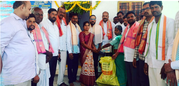
- ఈ పథకం పేదల గుండెల్లో నిలుస్తుంది:పిఎసిఎస్ చైర్మన్ నర్సిములు

- సన్న బియ్యం పంపిణీ చరిత్రాత్మకం:కోస్లి మార్కెట్ కమిటీ చైర్మన్ ముద్ది బీములు