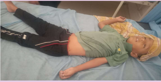
నారాయణపేట జిల్లా ప్రతినిధి ప్రజా జ్యోతి ఏప్రిల్ 02: