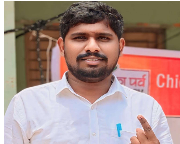
కారణం రాజకీయ చదరంగంలో భాగమేనని అన్నారు.