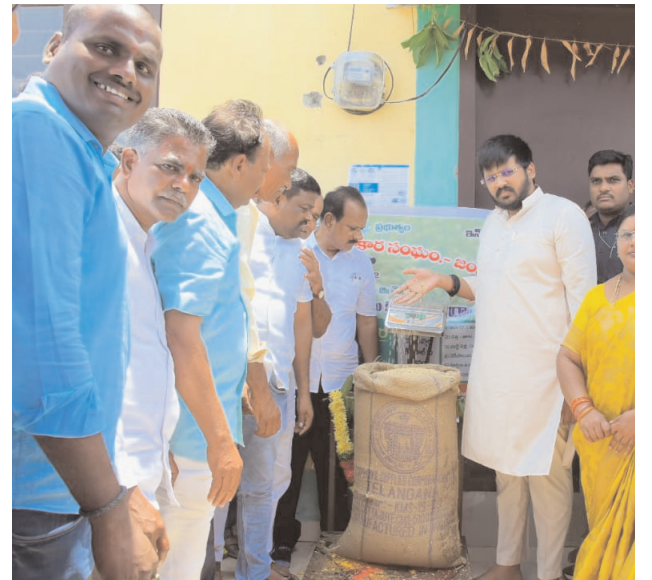
రూ.2320 , సాధారణ రకానికి రూ.2300 నిర్ణయించి సందని వెల్దుర్తిచారు. ఈ కార్యక్రమంలో ప్రజా ప్రతినిధులు ప్రభుత్వ అధికారులు తదితరులు పాల్గొన్నారు