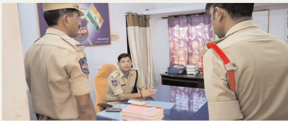
పోలీస్ స్టేషన్ ఆకస్మిక తనిఖీ చేసిన జిల్లా ఎస్పీ.