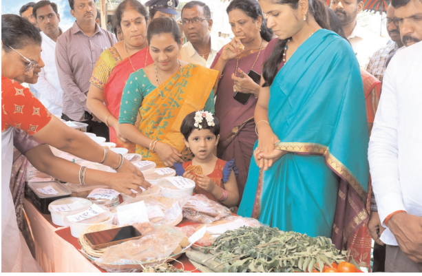
-గర్భస్థ శిశువు నుంచి పోషకాహార లోపం రాకుండా చూడాలి