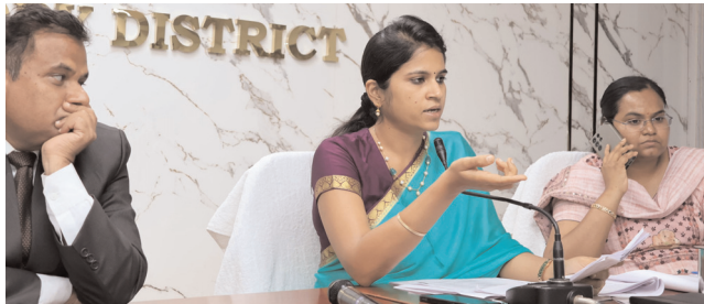
అధికారులను ఆదేశించారు. ఆయా సదస్సులలో ప్రజలకు ఈ చట్టంపై నిజితంగా అవగాహన కల్పించాలన్నారు. భూ సమస్యలకు శాశ్వత పరిష్కారం చూపేందుకు తీసుకొచ్చిన భూ భారతి ని ప్రజల్లోకి విస్తృతంగా తీసుకెళ్లాలని, రైతు సంఘాల నాయకులు, సభ్యులను కూడా ఈ సదస్సులో భాగస్వామ్యం చేయాలని, చట్టంలో ఉన్న ప్రాధాన్యత అంశాల వివరాలను ప్రజలకు అర్థమయ్యే విధంగా కరపత్రంపై ముద్రించాలన్నారు. ఆర్.ఓ.ఆర్ తప్పుల సవరణ సెక్షన్-4, 5, 7 ల గురించి, అలాగే ఏ సమస్యకి ఎలా అప్రోచ్ చేసుకోవాలి అనే అంశం మీద క్షుణ్ణంగా పవర్ పాయింట్ ప్రజెంటేషన్ ద్వారా ఈ సదస్సులో అవగాహన కల్పించాలన్నారు.