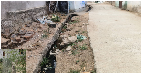
మురికి నీరు నిల్వ వుంటోదని స్థానికులు రోగాలబారిన పడకముందే చర్యలు తీసుకోవాలని కొరుతున్నారు.

మల్లాపూర్ ఏప్రిల్ 03, ప్రజాజ్యోతి: మల్లాపూర్ మండలంలోని ఓబులపూర్ గ్రామంలో పారిశుధ్యం పడకేసింది. మురికి కాలువల్లో చెత్తాచెదారం పేరుకుపోయి కాలనీలు కంపుకొడుతున్నాయి. మండల అధికారుల పారిశు ధ్యంపై పర్యవేక్షణ లేకపోవడంతో ప్రజలకు ఇబ్బందులు తప్పడం లేదు. ఇటీవల వాల్లోండ గ్రామంలో ఇంటి యజమాని డ్రెయినేజీ తీసిన ప్రక్రియ అధికారుల పనితీరును యెద్దేవా చేసినట్లైంది. ఇదే తరహాలో గత కొంత కాలంగా ఓబులపూర్ లో అటు వైపు పారిశుధ్య పనులే చెబట్టడం లేదని పారిశుధ్య పని తీరుపై అసంతృప్తిని వ్యక్తం చేస్తున్నారు. డ్రెయినేజీ తీయకపోవడంతో పిచ్చి మొక్కలు పెరిగి