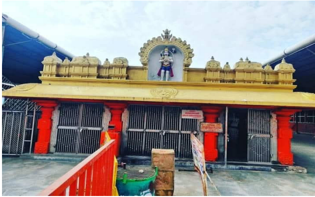
జగిత్యాల బ్యారో, ఏప్రిల్ 2, (ప్రజాజ్యోతి)