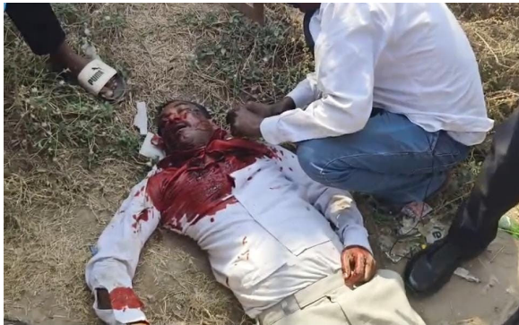
జమ్మికుంట, ఏప్రిల్ 17 (నినాదం స్వ్యాస్):

జమ్మికుంట పట్టణంలోని పెట్రోల్ బంక్ సమీపంలో రోడ్డు ప్రమాదం జరగడంతో ఒక వ్యక్తికి తీవ్ర గాయాలయ్యాయి. మంగళవారం జమ్మికుంటలో రోడ్డు ప్రమాదంలో ఒక వ్యక్తి మృతి చెందిన ఘటన మర్చిపోకముందే బుధవారం మరొక వ్యక్తి ద్వీచక్ర వాహనం పై వస్తూ ట్రాక్టర్ డీకొని తీవ్ర గాయాలైన ఘటన జమ్మికుంటలో చోటుచేసుకుంది. జమ్మికుంట పట్టణానికి