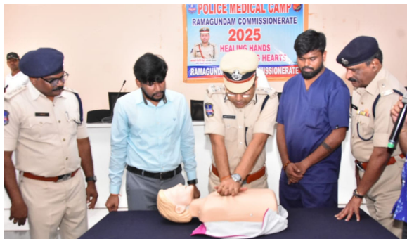
పెద్దపల్లి జిల్లా ప్రతినిధి, (ప్రజా జ్యోతి), ఏప్రిల్ 16:

ఆరోగ్య సమస్యల పట్ల శ్రద్ధ వహించాలి - రామగుండం పోలీస్ కమిషనర్ అంబర్ కిషోర్ ఝా ఐపిఎస్