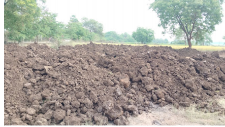
అక్రమార్కులపై కొరడా రుఖించాలని ప్రజలు కోరుతున్నారు.

జరుగుతుంటే గ్రామంలో ఉన్న పంచాయతీ కార్యదర్శి ఏం చేస్తున్నాడని అనుమానాలు వెల్లువెత్తుతున్నాయి. ఈ తతంగం అంతా అధికారుల కనుసన్నల్లో జరుగుతుందని అనుమానాలు పెద్ద ఎత్తున వస్తున్నాయి. ఎక్కడో ఆంధ్ర ప్రాంతానికి చెందిన వ్యక్తి గ్రామానికి వచ్చి ఇటుక తయారీ కోసం ఎలాంటి ముందస్తు అనుమతులు లేకుండా రాత్రికి రాత్రి గుట్టు చప్పుడు లేకుండా నల్లమట్టిని తరలించడంపై గ్రామంలో చర్చ నీ అంశంగా మారింది. పలు శాఖల అధికారులకు మామూళ్ళు అందుతుండటం వల్లే చూసి చూడనట్లుగా వ్యవహరిస్తున్నారని స్థానికులు ఆరోపిస్తున్నారు. ఇప్పటికైనా సంబంధిత అధికారులు స్పందించి