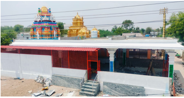
అత్యంత సుందరంగా దేవాలయం నిర్మాణ పనులు పూర్తి చేస్తామన్నారు. దాతలు స్థానికులు సహకరించాలని కోరారు.