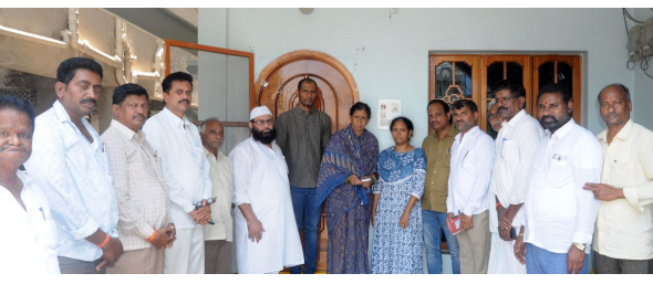
కోదాడ టౌన్ ,ఏప్రిల్ 01( ప్రజా జ్యోతి): కోదాడ లారీ అసోసియేషన్