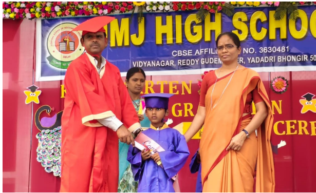
నిలబడి అందరినీ ఆకట్టుకున్నారు. అనంతరం చిన్నారుల ద్వారా వినోదాత్మకంగా, సాంస్కృతిక కార్యక్రమాలు నిర్వహించారు. ఈ కార్యక్రమంలో పాఠశాల ఉపాధ్యాయ బృందం, తల్లిదండ్రులు, విద్యార్థులు పెద్ద ఎత్తున పాల్గొన్నారు.