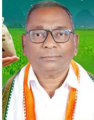
పార్టీ ఎల్లప్పుడు ముందుంటుందిని ఈ సందర్భంగా అన్నారు.

గారు ప్రజల కోసం ప్రజా ప్రభుత్వంలో ప్రతి పేదవారు సన్న బియ్యం తినాలని ఒక గొప్ప సంకల్పంతో సన్న బియ్యం పంపిణీ చేస్తామని హామీ ఇవ్వడం జరిగింది.. అందులో భాగంగా సన్నబియ్యం పంపిణీ గిట్టుబాటు ధరతో పాటు కింటాకు 500 రూపాయల బోనస్ ఇస్తామని ప్రచారం చేయడం జరిగింది తెలంగాణ రాష్ట్రంలో చాలామంది రైతులు సన్న వద్దు పండించడం ఆ వద్దు కొనుగోలు చేసిన ప్రభుత్వం మళ్ళీ అదే రైతులకు పేదలకు ఉచితంగా ఒక్కరికి ఆరు కిలోల చొప్పున సన్న బియ్యం పంపిణీ చేయడం జరుగుతుందని ఇదే ప్రజా ప్రభుత్వమని ప్రజల కోసం కాంగ్రెస్