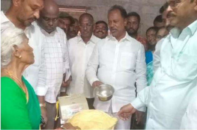
చిట్టలపిట్టల్, 1 (ప్రజాజ్యోతి):

పేదవారి ఆకలి తీర్చడం కోసం సన్నబియ్యం చేరాలనే సంకల్పంతో