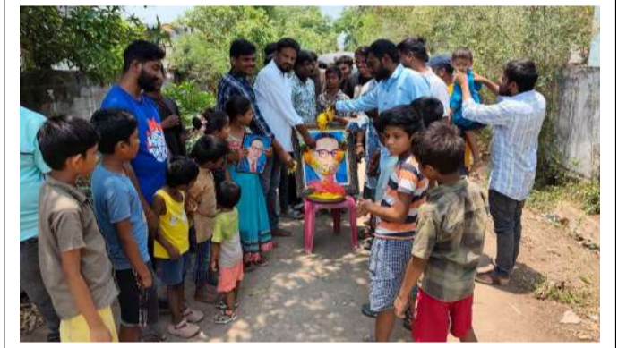
నిర్వహించారు. మండలంలోని అంగన్నాడి కేంద్రాలలో ఘనంగా చేపట్టారు.