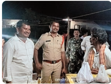
వెళుతూ జగన్మోహన్ రెడ్డి సంతలో ఆగారు.

■ సామాన్యుడిగా ప్రజలతో కలిసి తిరిగి నిత్యావసరాలను కొనుగోలు చేసిన ఎమ్మెల్యే జార్జీ