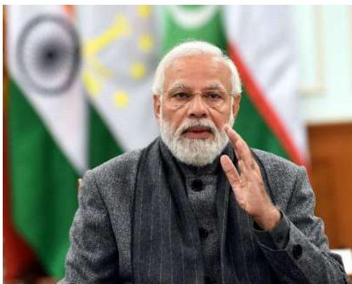
అధిపతులతో చెప్పారు. ప్రభుత్వం గడచిన పది సంవత్సరాలుగా పరిశ్రమలతో కలిసి పని చేస్తున్నదని, సంస్కరణలు చేపట్టడానికి, ఆర్థిక క్రమశిక్షణకు, పారదర్శకతకు, సమీకృత వృద్ధికి తన నిబద్ధతను ప్రదర్శించింది ప్రధాని తెలియజేశారు. "ఇప్పుడు భారత్

న్యూఢిల్లీ : నాణ్యమైన వస్తువులు ఉత్పత్తి చేయగల విశ్వసనీయ భాగస్వామిగా భారత్ వైపు ప్రపంచం చూస్తున్న తరుణంలో భారతీయ పరిశ్రమ రంగం ప్రపంచ అవకాశాల సద్వినియోగానికి 'భారీ చర్యలు' తీసుకోవాలని ప్రధాని నరేంద్ర మోడీ మంగళవారం కోరారు. "నియంత్రణ, పెట్టుబడి, వ్యాపార సంస్కరణలు, నిర్వహణలో సౌలభ్యం" అంశంపై బడ్జెట్ అనంతర వెబినార్లో మోడీ ప్రసంగిస్తూ, ప్రపంచవ్యాప్తంగా ఆర్థిక అనిశ్చితుల వల్ల ఏర్పడిన సప్లై చెన్స్ అంతరాయాల నడుమ ప్రపంచానికి ఇప్పుడు అధిక నాణ్యమైన వస్తువులు ఉత్పత్తి చేయగల, ఆధారపడదగిన సప్లై చెన్స్ ఉన్న విశ్వసనీయ భాగస్వామి అవసరం ఉన్నదని చెప్పారు. "మన దేశానికి ఈ పని చేయగల సత్తా ఉంది, మీ అందరూ (పరిశ్రమ) సత్తా ఉన్నవారు, ఇది మనకు మహత్తర అవకాశం. ప్రపంచం అంచనాలను కేవలం ఒక వీక్షకునిగా మన పరిశ్రమ చూడరాదని కోరుకుంటున్నా. మనం వీక్షకులుగా ఉండిపోతూ, దీనిలో మీకు ప్రాత్ర ఉందని మీరు గ్రహించవలసి ఉంటుంది, మీ కోసం అవకాశాలను మీరు కోరుకోవలసి ఉంటుంది" అని ప్రధాని మోడీ పారిశ్రామిక