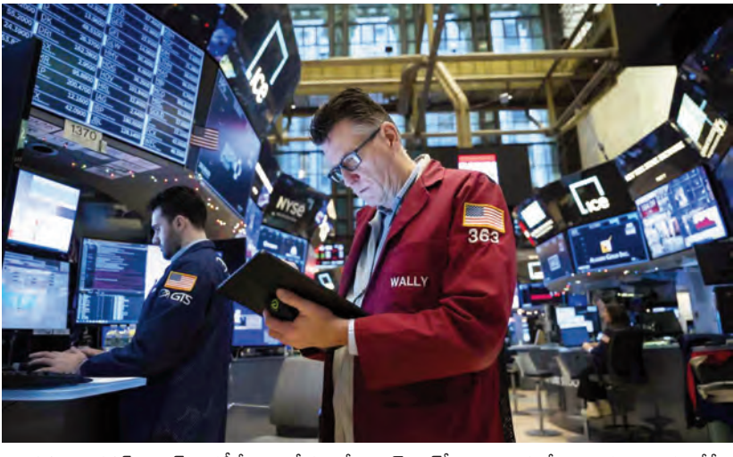
ఇన్వెస్టర్ల ఫెడరల్ రిజర్వ్ వడ్డీరేట్లపై తీసుకొనే ఎన్ఆంఠి 500 సూచీ ఫిబ్రవరి 19వ తేదీన నిర్ణయం కోసం ఆసక్తిగా ఎదురుచూస్తున్నారు. సమాచారం మిగతా 2లో..

న్యూయార్క్, మార్చి 11 (ప్రజాజ్యోతి): అమెరికా స్టాక్ మార్కెట్లలో దాదాపు 20 రోజుల వ్యవధిలోనే భారీగా పతనం అయ్యాయి. స్టాక్ లోని మదుపు సంపద 4 ట్రిలియన్ల దాకం మేర అంటే దాదాపు రూ. 349 లక్షల కోట్లు మేరకు ఆవిరిచెప్పింది. ఇది యూకే, ఫ్రాన్స్ వంటి దేశాల జీడీపీ కంటే ఎక్కువ కావడం గమనార్హం. ముఖ్యంగా అమెరికా ఫెడరల్ గవర్నమెంట్ పోలియో భయాల సూచనలు వెంటాడుతున్నాయి. దీనికి ట్రంప్ ఆస్తి విధానాలు తోడయ్యాయి. ఓవైపు మార్కెట్ల పతనం అవుతున్నా.. ఆర్థిక వ్యవస్థ మాత్రం బలంగానే ఉందని వైట్ హౌస్ ప్రకటించింది. వైట్ హౌస్ ప్రకటనలోని ది నేషనల్ ఎకనామిక్ కోన్సిల్ అధిపతి కెవిన హార్నెట్ల చెప్పారు. ఆర్థిక మాంద్యం భయాలను తోసిపుచ్చారు. ఆర్థిక వ్యవస్థ బలంగా ఉందని చెప్పేందుకు పలు కారణాలున్నాయన్నారు. ఇక సుంకాల విషయంలోని అన్యాయ తీర్మానం కోల్పోవడం తొలగిపోతుందన్నారు. ఇక పన్ను కోతలు పెట్టబడటంను ప్రోత్సహిస్తామని ఆశాభావం వ్యక్తం చేశారు. తాజా పరిస్థితుల నేపథ్యంలో