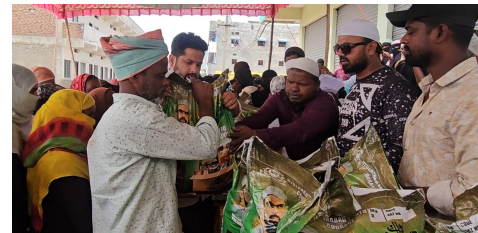
చేయడం తమ ప్రధాన లక్ష్యమని తెలిపారు. కుల, మత భేదాలు లేకుండా అందరికీ సేవలు అందిస్తామని పేర్కొన్నారు.