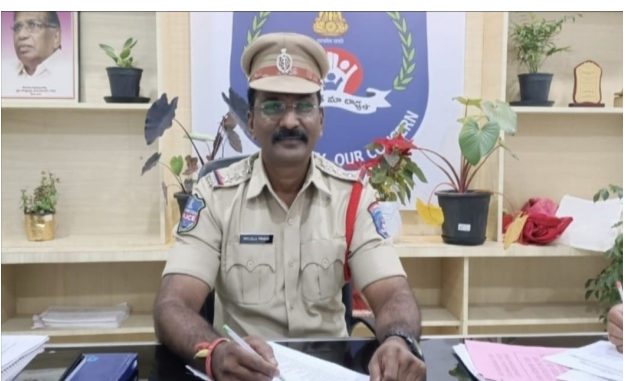
ప్రజల పోలీసులకు సహకరించి హెబాలీ పండుగను శాంతియుతంగా జరుపుకోవాలని కోరారు.

హెబాలీ పండుగ సందర్భంగా ప్రజల శాంతిభద్రతలను పరిక్షించేందుకు తోడ్పడాలని నందిగామ ఇన్స్పెక్టర్ ప్రసాద్ తెలిపారు. శుక్రవారం ఉదయం నుంచి మధ్యాహ్నం 12 వరకు జరుపుకోవాలని సూచించారు. ఆ తర్వాత ఎవరైనా హెబాలీ ఆడుతున్నట్లు తెలిస్తే తగు చర్యలు తీసుకోవాలని కోరారు. ఇప్పవడని పుక్తలు ప్రదేశాలు వాహనాలపై రంగులు చెల్లతే కఠినంగా నిషేధించబడిందన్నారు. ఎవరైనా అనుమతి లేకుండా బలవంతంగా రంగులు పోయడం శరీరక మానసిక వేధింపులకు గురి చేయడం తీవ్రంగా నేరం కిందికి పరిగణించబడుతుందని పేర్కొన్నారు. పబ్లిక్ రోడ్డు బహిరంగ ప్రదేశాల్లో ఇతరులను ఇబ్బంది పెట్టడం అసభ్యంగా ప్రవర్తించడం మద్యం మత్తులో అల్లర్లు చేయడం నిషేధమని అన్నారు.