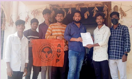
చేవెళ్ల మార్చి 13 (ప్రజా జ్యోతి):

- చేవెళ్ల ఎమ్మార్వో కి వినతి పత్రం ఇచ్చిన ఏబీవీపీ నాయకులు