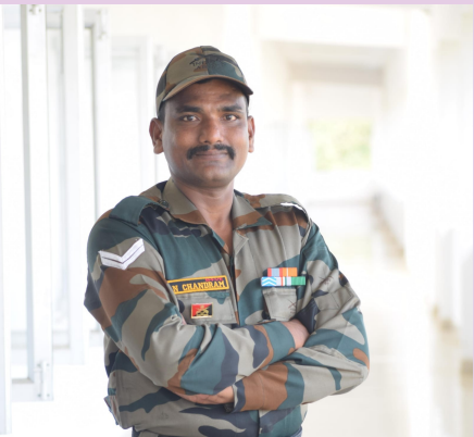
రాయపాల్ మార్చి 13 ప్రజా జ్యోతి: