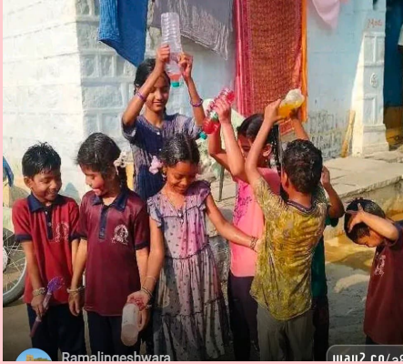
కర్త 5.13. మార్చి. ప్రజాజ్యోతి

సంగారెడ్డి జిల్లాలోని కల్లెర్ మండలం ఊరు వాడ తేడా లేకుండా ప్రతి గ్రామంలో చతుర్దశి కామదానం నిర్వహించి ఉదయం రంగు రంగుల రంగవల్లితో పర్యావరణానికి హాని లేకుండా చిన్న పెద్ద తేదాలూ లేకుండా కుల మతాలకు అతీతంగా గ్రామంలో ప్రజలు ఉదయం హెూళీ వేడుకలు జరుపుకున్నారు. రంగులు చల్లుకుంటూ వేడుకల్ పాల్గొన్నారు. ఆనవాయితీగా వస్తున్న కాముడి గుండు ఎత్తడంలో మల్ల యోధులు. సాహస యువకులు పోటీ పడ్డారు ప్రతి గ్రామంలో మార్చి ఉల్లాసంతో పండుగ వాతావరణం నిర్వహించడం జరిగింది.