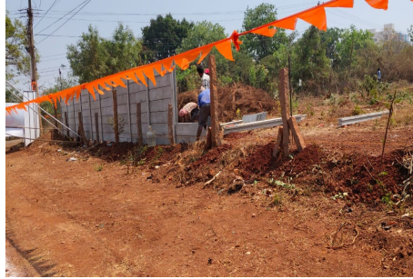
- కలెక్టరేట్కు కూతవేటు దూరంలో కోట్ల విలువైన ప్రభుత్వ భూమి కబ్జా..!