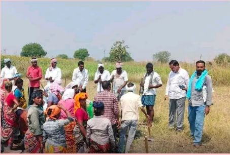
కర్త. 11. మార్చి. ప్రజా జ్యోతి.