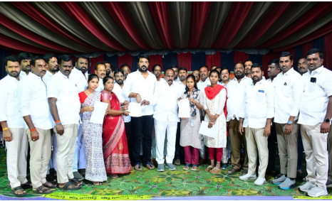
- 122 హాజరు కాగా 69 మంది సెలెక్ట్