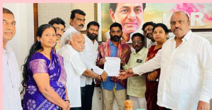
కుత్బుల్లాపూర్ ఫిబ్రవరి 28(ప్రజా జ్యోతి)