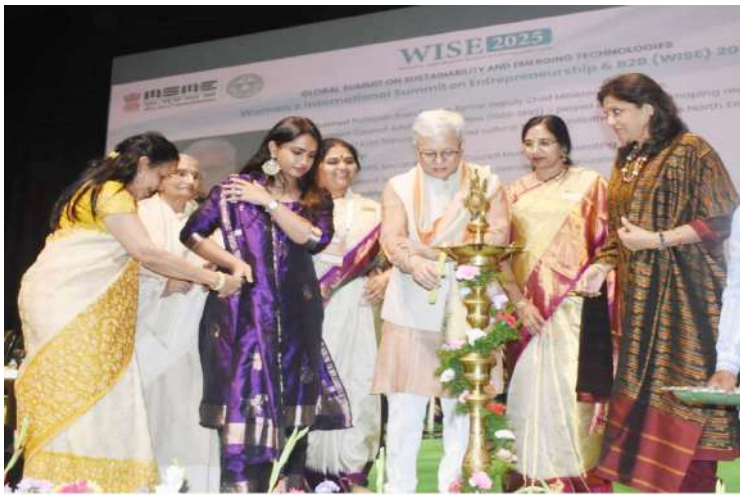
- బీ2బీ ఎక్స్పో 2025 ప్రారంభం