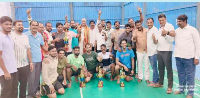
అబ్దుల్లాపూర్ మెట్టు ఫిబ్రవరి 28(ప్రజా జ్యోతి)