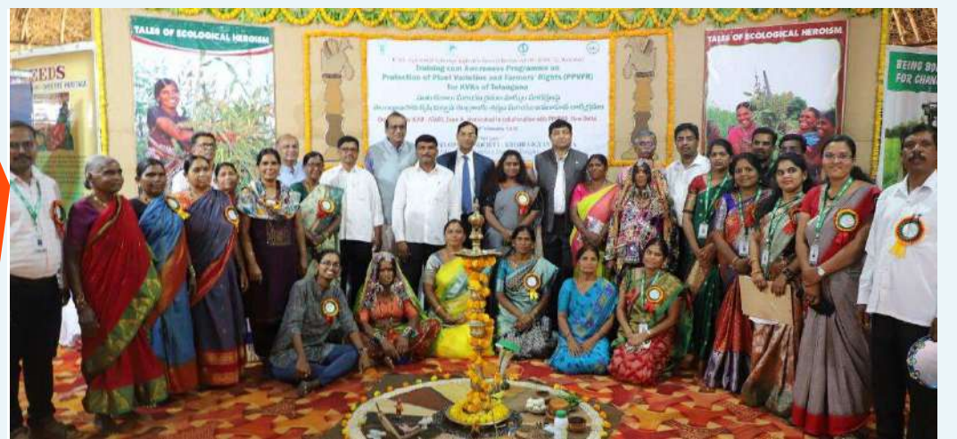
జహీరాబాద్, ఫిబ్రవరి 28 ( ప్రజా జ్యోతి న్యూస్ )

డెక్లన్ డెవలప్ మెంట్ సొసైటీ కృషి విజ్ఞాన కేంద్రం, డిగ్గి గ్రామం అవరణంలో భారతీయ వ్యవసాయ పరిశోధన మండలి, అటారి జోన్ 10 వారి ఆధ్వర్యంలో పంటల రకాలు మరియు రైతుల హక్కుల పరిరక్షణ (పి.పి.వి. యఫ్.ఆర్.ఏ) న్యూ డిల్లీ వారి సహకారంతో “పంట రకాల మరియు రైతుల హక్కుల పరిరక్షణ పై తెలంగాణ లోని కృషి విజ్ఞాన కేంద్రాలకు శిక్షణ మరియు - మిగతా2లో