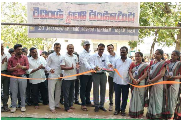
- దయానంద విద్యార్థులు సైన్స్ లో జాతీయస్థాయిలో అద్భుతాలు సృష్టిస్తారు