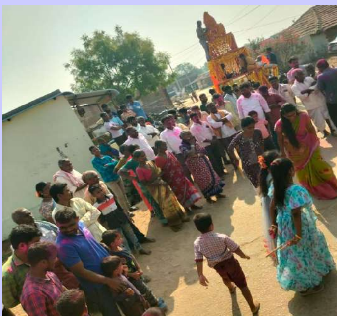
రాయపోల్ ఫిబ్రవరి 28 ప్రజా జ్యోతి

రామారం గ్రామంలో ఆధ్యాత్మిక శోభ తరలివచ్చిన భక్తజనం