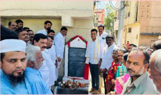
కుత్బుల్లాపూర్ మాన్వీ 7(ప్రజా జ్యోతి )

- బిఆర్ఎస్ పార్టీ విప్, ఎమ్మెల్యే కె.పి.వివేకానంద్