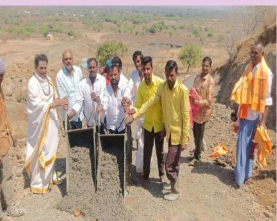
జహీరాబాద్, మార్చి 07( ప్రజా జ్యోతి న్యూస్ )