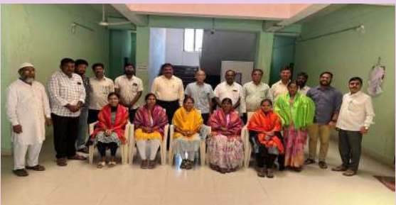
మెదక్ (ప్రజాజ్యోతి) 07 మార్చి-2025

మహిళా శక్తిని, యుక్తిని చాటి చెప్పేలా మార్చి 8న అంతర్జాతీయ మహిళా దినోత్సవం ఘనంగా నిర్వహించుకోవాలని జడ్పీ సీకేడ ఎల్లయ్య తెలిపారు. అంతర్జాతీయ మహిళా దినోత్సవాన్ని పురస్కరించుకుని శుక్రవారం మెదక్ జిల్లా కేంద్రంలో జడ్పీ సీకేడ కార్యాలయంలో పనిచేస్తున్న మహిళా ఉద్యోగులను సీకేడ ఎల్లయ్య, కార్యాలయ ఉద్యోగులు కలిసి శాలువాలతో ఘనంగా సత్కరించారు. ఈ సందర్భంగా ఈ సందర్భంగా జెడ్పీ సీకేడ ఎల్లయ్య మాట్లాడుతూ సామాజిక, ఆర్థిక, సాంస్కృతిక రంగాలతో సహా వివిధ రంగాల్లో మహిళామణులు సాధించిన విజయాలను గుర్తించి, గౌరవించేందుకు. వారిని స్ఫూర్తిగా తీసుకొని మరింత మంది సమాగ్రాభివృద్ధి దిశగా ముందుకు వేసేలా ప్రోత్సహించేందుకు ఏటా మార్చి 8న అంతర్జాతీయ మహిళా దినోత్సవం జరుగుతుందని వివరించారు. ఈ కార్యక్రమంలో జడ్పీ సీకేవో కార్యాలయ ఇతర అధికారుల సిబ్బంది పాల్గొన్నారు.