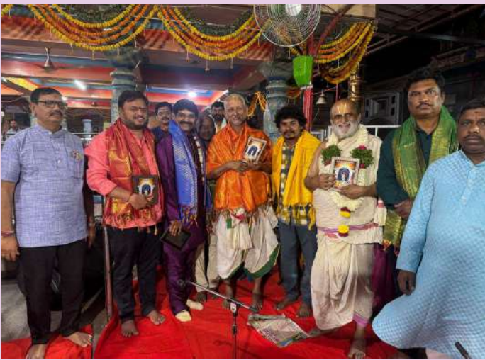
మొయినాబాద్ మార్చ్ 01( ప్రజా జ్యోతి)

కుందన సంగీత నిలయ విద్యార్థిని విద్యార్థులందరూ సంగీత కచేరీ కడురమ్మంగా స్వామివారి ముందు గానం చేశారు