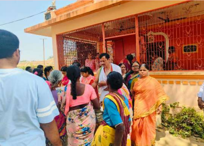
కొడిపల్లి ప్రజా జ్యోతి మార్చ్ 1