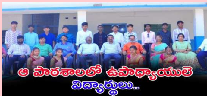
కొల్వారం(ప్రజాజ్యోతి) మార్చి 01 :

- అంసాన్ పల్లిలో స్వయం పరిపాలనా దినోత్సవం