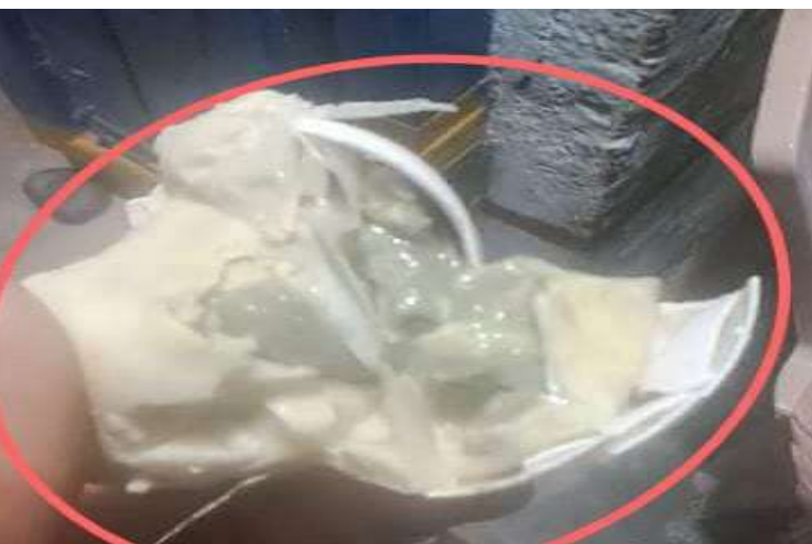
చౌదాపూర్ మండల్ (ప్రజా జ్యోతి) మార్చి 01 :

వికారాబాద్ జిల్లా చౌదాపూర్ మండల కేంద్రంలోని విరలాపూర్ గ్రామంలో గర్భిణీ స్త్రీలకు, చిన్న పిల్లలకు, బాలింతలకు పౌష్టికాహారం కోసం బాలామృతం పథకం ద్వారా ప్రభుత్వం కోడిగుడ్లను పంపిణీ చేస్తుంది. అలాంటి కోడి గుడ్లు పూర్తిగా కుళ్ళిపోయినా గుడ్లు పంపిణీ చేసిన ఘటన మండల పరిధిలోనే విరలాపూర్ గ్రామంలో చోటు చేసుకుంది. కొన్ని ఏజెన్సీల ద్వారా అంగన్వాడి కేంద్రాలకు కోడి గుడ్లను ప్రభుత్వం సరఫరా చేస్తుంది. విరలాపూర్ గ్రామంలో గుడ్లను అంగన్వాడీ కేంద్రంలో చిన్నపిల్లలకు పంపిణీ చేశారు. వాటిని ఇంటికి తీసుకు వెళ్లిన గర్భిణీలు గుడ్లను తినడానికి చూడగా గమనించిన గర్భిణీలు వాటిని పగలగొట్టి చూడగా వాటి నుండి దుర్వాసన, అవి కుళ్ళిపోయి ఉండడం గమనించిన లబ్ధిదారులు వాటిని అంగన్వాడీ టీచర్ ద్రుష్టికి తీసుకెళ్ళగా గుడ్లు అక్కడినుండి వస్తే నాకేం సంబంధం అని గ్రామస్తులకు సమాధానం ఇవ్వడం జరిగింది. ఒకవేళ కుళ్ళిపోయినా గుడ్లను గమనించకుండా గర్భిణీలు, మా పిల్లలు తింటే మా పిల్లలకు, కుటుంబ సభ్యులకు