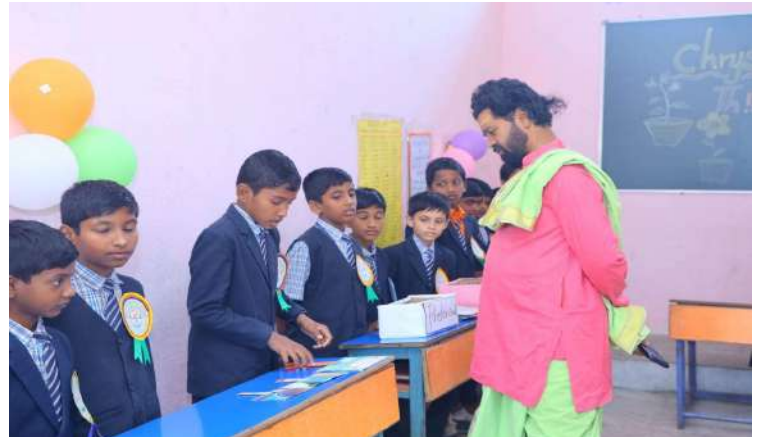
ప్రతిభను, సృజనాత్మకతను పెంపొందించడానికి విద్యా వైజ్ఞానిక