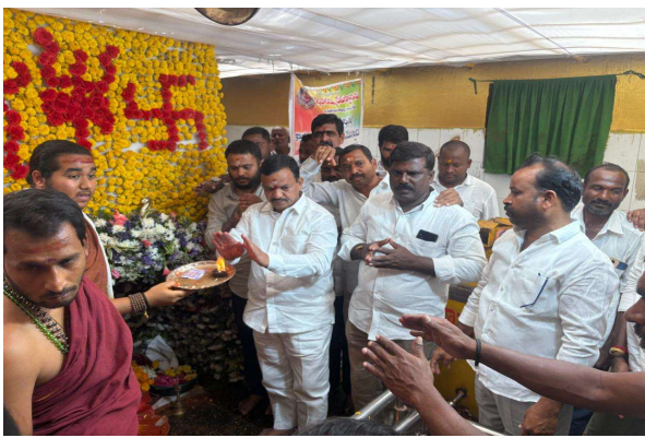
కొడిపల్లి ప్రజా జ్యోతి మార్చి 20