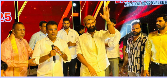
కుత్బుల్లాపూర్ మార్చి 20(ప్రజా జ్యోతి)