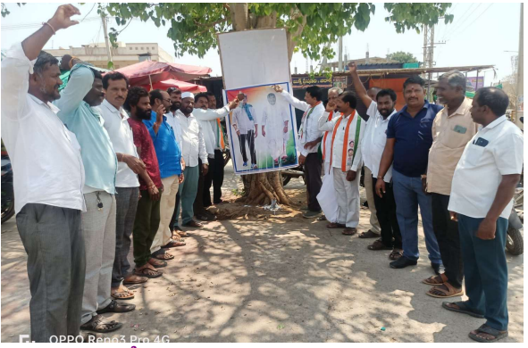
కొడిపల్లి ప్రజా జ్యోతి మార్చి 20

రాష్ట్రంలో బీసీలకు 42% రిజర్వేషన్ కల్పించడంతో మండల కాంగ్రెస్ పార్టీ అధ్యక్షుడు శ్రీనివాసరావు ఆధ్వర్యంలో గురువారం రోజున మండల కేంద్రంలోని బస్టాండ్ ప్రాంగణం ముఖ్యమంత్రి రేవంత్ రెడ్డి ఉప ముఖ్యమంత్రి బద్ది విక్రమార్క చిత్రపటాలకు పాలాభిషేకం నిర్వహించారు అనంతరం మండల కాంగ్రెస్ పార్టీ అధ్యక్షుడు శ్రీనివాసరావు మాట్లాడుతూ ఏ రాష్ట్రంలో లేకుండా తెలంగాణ రాష్ట్రంలో ముఖ్యమంత్రి రేవంత్ రెడ్డి ఆధ్వర్యంలో బీసీలకు 27 శాతం ఉన్న రిజర్వేషన్ను 42