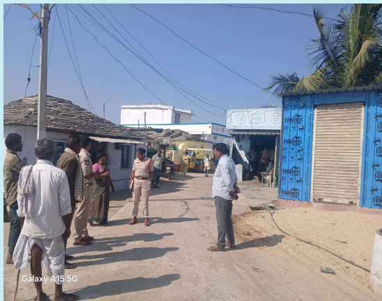
ధారూర్ మర్చి 20(ప్రజా జ్యోతి)