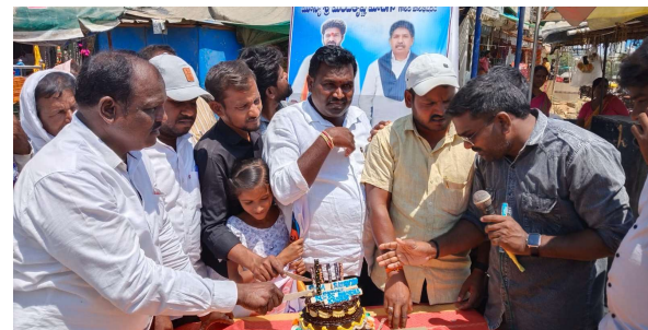
70 ఏళ్ల మాదిగల కల నెరవేరిందని అన్నారు. డా.అంజేద్ సర్ దళితులకు రిజర్వేషన్లు అందిస్తే మంద కృష్ణ మాదిగ ఆ రిజర్వేషన్లను దళితుల్లోని అన్ని కులాలకు అందిస్తున్నారని అన్నారు మాదిగ అమరుల త్యాగాలు ఉద్యమం లక్ష్యం వైపు సాగేలా నడిపించాయని, అమరులకు జోహార్లు తెలిపారు. ఎస్సీ వర్గీకరణ కోసం సహకరించిన అన్ని పార్టీలకు, సంఘాలకు కృతజ్ఞతలు తెలిపారు. ఎస్సీ వర్గీకరణను వెంటనే అమలు లోకి తీసుకురావాలని కోరారు. ఈ కార్యక్రమంలో ఎమ్మార్పీఎస్ నాయకులు దళిత సంఘ నాయకులు మాదిగలు పాల్గొన్నారు.

మందకృష్ణ మాదిగ సుదీర్ఘ కాలం మదమ తిప్పకుండా రాజీలేని పోరాటం చేయడం వలన నేడు తెలంగాణ రాష్ట్ర అసెంబ్లీలో ఎస్సీ వర్గీకరణ బిల్లు ఏకగ్రీవంగా ఆమోదం పొందిందని మద్దూర్ ఎమ్మార్పీఎస్ మాదిగ నాయకులు అన్నారు. మద్దూరు మండల కేంద్రంలో డా.బి.ఆర్ అంజేద్ సర్ విగ్రహం ముందు ఎస్సీ వర్గీకరణ ఆమోదం పొందడాన్ని స్వాగతించి ఎమ్మార్పీఎస్, ఆధ్వర్యంలో తెలంగాణ రాష్ట్ర ముఖ్యమంత్రి రేవంత్ రెడ్డికి మరియు పద్మశ్రీ మందకృష్ణ మాదిగ చిత్రపటానికి పాలాభిషేకం చేసి కేక్ కట్ చేసి సంబరాలు నిర్వహించారు. అలాగే మాదిగ అమరులకు నివాళులర్పించి బాణసంచా కాల్చి మిఠాయి లు పంచుకున్నారు. ఈ కార్యక్రమంలో వివిధ నాయకులు మాట్లాడుతూ “మంద కృష్ణ మాదిగ లేకుంటే ఎస్సీ వర్గీకరణ పోరాటం లేదని అన్నారు. తెలంగాణ రాష్ట్ర అసెంబ్లీలో ఎస్సీ వర్గీకరణ ఆమోదం పొందడం ద్వారా