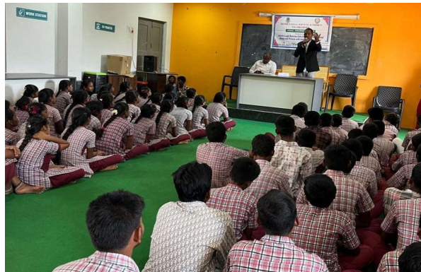
వైకల్యం గల వ్యక్తులను హింసించినా, క్రూరంగా ప్రవర్తించిన, అసహ్యంగా మాట్లాడినా జైలుకు జైలు శిక్ష ఉంటుందన్నారు. ఈ కార్యక్రమంలో ప్రధానోపాధ్యాయుడు, ఉపాధ్యాయులు, విద్యార్థులు పాల్గొన్నారు.