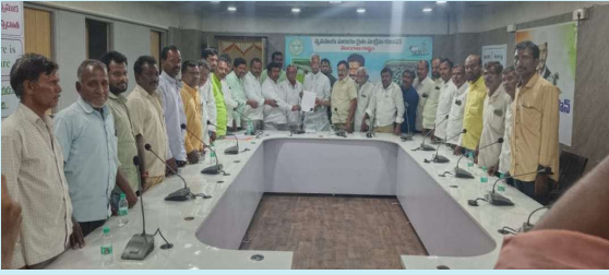
యూవారం, మార్చి 20 (ప్రజాజ్యోతి):