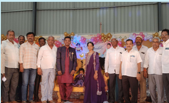
మల్లకల్ మర్చి 20(ప్రజా జ్యోతి ప్రతినిధి):