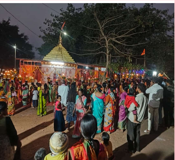
జుహూరాబాద్, మార్చి 18 (ప్రజా జ్యోతి న్యూస్ )