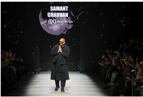
Indian Designers Shine at Fourth Moscow Fashion Week

శేరిలింగంపల్లి, మార్చి 18 (ప్రజాజ్యోతి):