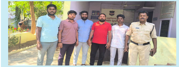
విన్నకోడూరు, మార్చి 18 (ప్రజా జ్యోతి):