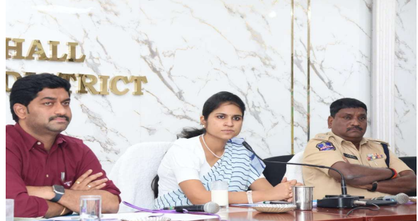
చేపట్టినట్లు జిల్లా కలెక్టర్ వల్లూరు క్రాంతి అన్నారు. ప్రభుత్వ పాఠశాలలో విద్యార్థులకు ప్రభుత్వ పరంగా కల్పిస్తున్న సౌకర్యాలను కలెక్టర్ వివరించారు. ఉపాధి కల్పనలో ఎస్సీ, ఎస్టీ వర్గాలకు రిజర్వేషన్ అమలు. స్టైఫెండ్, ఉపకార వేతనాల పంపిణీ , అమలులో సాంకేతిక సమస్యలు. ఎస్సీ,ఎస్టీ వర్గాలకుకేటాయించిన భూముల రక్షణ. అక్రమ అక్రమణలను అరికట్టి అందుకు తగిన చర్యలు తీసుకోవాలని అధికారులను ఆదేశించారు. సంక్షేమ హాస్పిటల్లో ఆహార నాణ్యతపై సమీక్ష. అంగన్వాడీ కేంద్రాల పనితీరు, పిల్లల ఆరోగ్య సంరక్షణ. తనికీలు నిర్వహించాలని అన్నారు. ఎస్సీ, ఎస్టీ వర్గాలపై జరిగే దాడులను అరికట్టేందుకు తీసుకోవాల్సిన ప్రత్యేక చర్యలు. బాధితులకు ప్రభుత్వ పరంగా సహాయం, పోలీస్ స్టేషన్లలో ఫిర్యాదుల స్వీకరణ, విచారణలో పారదర్శకత. నిరపాయంగా బాధితులకు న్యాయం అందించేందుకు చర్యలు తీసుకుంటామని పేర్కొన్నారు . ఈ సమీక్షా సమావేశంలో అదనపు ఎస్సీ సంజీవ రెడ్డి, జిల్లా సాంఘిక సంక్షేమ శాఖ అధికారి అఖిలేష్ రెడ్డి , జిల్లా వెనుకబడిన తరగతుల సంక్షేమ శాఖ అధికారి జగదీష్, ఆర్డీఓలు, డిస్ట్రిబ్యూ, జిల్లా విజిలెన్స్ మానిటరింగ్ కమిటీ సభ్యులు , సంబంధిత అధికారులు తదితరులు పాల్గొన్నారు .