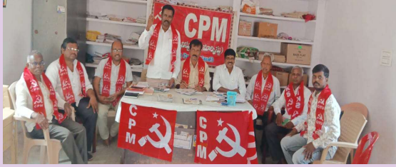
కల్వకుర్తి, మార్చి 29 (ప్రజా జ్యోతి):

- సిపిఎం జిల్లా కార్యదర్శి వర్ణం పర్వతాలు