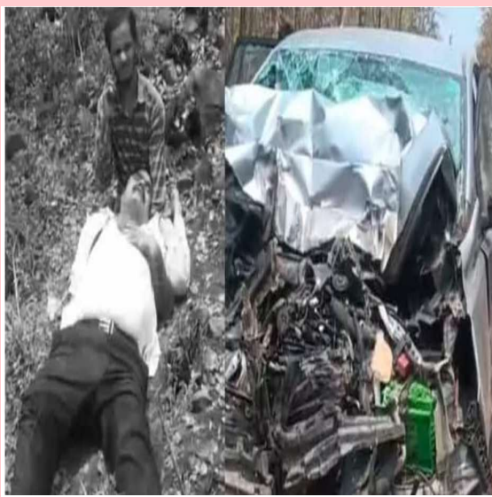
నాగర్ కర్నూల్ మార్చి 29 ప్రజా జ్యోతి ప్రతినిధి