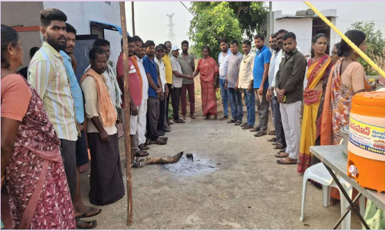
కల్వకుర్తి, మార్చి 29 (ప్రజా జ్యోతి):