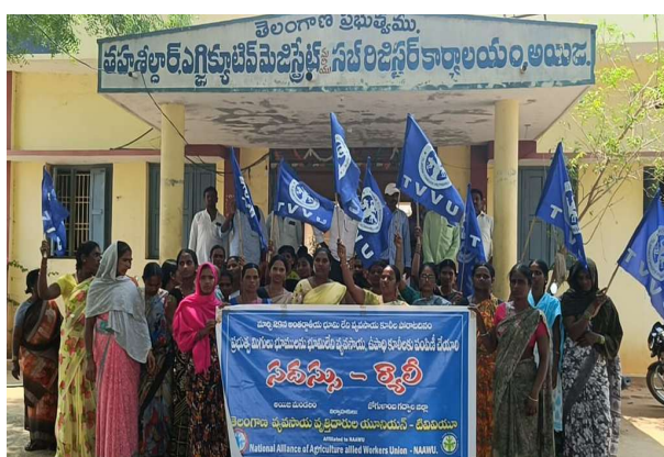
-గత ప్రభుత్వంలో భూమి ఇవ్వలేదు కాంగ్రెస్ ప్రభుత్వంలోనైనా నిరుపేదలకు సహాయం చేయాలి

అలంపూర్ డివిజన్ (ప్రజా జ్యోతి) మార్చి 29: