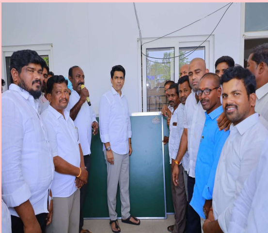
నాగర్ కర్నూల్, మార్చి 29 ప్రజా జ్యోతి