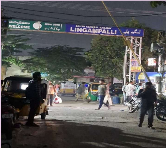
శేరిలింగంపల్లి, మార్చి 28 (ప్రజాజ్యోతి):