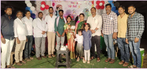
బషీరాబాద్ మార్చి 28 ప్రజా జ్యోతి