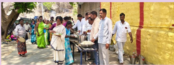
అడ్డాకుల, మార్చి 28 (ప్రజాజ్యోతి)

దక్షిణ కాశీగా పేరుగాంచి కోరిన కోరికలు తీర్చే కల్ప వృక్షాలకు నిలయమైన కందూరు రామలింగేశ్వర స్వామి ఆలయంలో గత వారం రోజుల నుండి ఉచిత అన్నదానం కార్యక్రమం కొనసాగు తుంది. కందూరు జాతర ప్రారంభం కావడంతో ఉగాది పండుగ వరకు ప్రతిరోజూ అన్నదానం కార్యక్రమం ఏర్పాటు చేసినట్లు ఆలయ నిర్వాహకులు తెలిపారు. జాతరకు వచ్చిన భక్తులు రామలింగేశ్వర స్వామిని దర్శించుకుని, కల్ప వృక్షాలకు పూజలు చేసి ఆలయంలో ఏర్పాటు చేసిన ఉచిత అన్నదానం కార్యక్రమంలో పాల్గొని భోజనాలు చేస్తున్నారు.