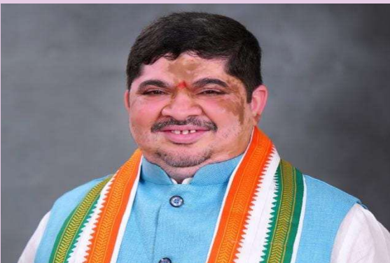
హుస్సాబాద్, మర్చి 28 (ప్రజా జ్యోతి):

హుస్సాబాద్ నియోజక వర్గంలోని అక్కన్న పేట్ మండల పరిషత్ కార్యాలయ నూతన భవన నిర్మాణానికి 1.5 కోట్ల రూపాయలు మంజూరు చేస్తూ పంచాయతీరాజ్ గ్రామ అభివృద్ధి శాఖ ఉత్తర్వులు జారీ చేసింది. మంత్రి పొన్నం ప్రభాకర్ చొరవతో అక్కన్నపేట నూతన మండల పరిషత్ కార్యాలయం మంజూరు కావడం పట్ల హుస్సాబాద్ ప్రజలు హర్షం వ్యక్తం చేస్తున్నారు. 2 రోజుల క్రితం శాతవాహన యూనివర్సిటీ ఇంజనీరింగ్ కాలేజీ హుస్సాబాద్ కు రావడం, తాజాగా అక్కన్నపేట మండల పరిషత్ కార్యాలయానికి నూతన భవనాన్ని నిధులు మంజూరు కావడం పట్ల మంత్రి పొన్నం ప్రభాకర్ కు హుస్సాబాద్ ప్రజలు ధన్యవాదాలు తెలిపారు.