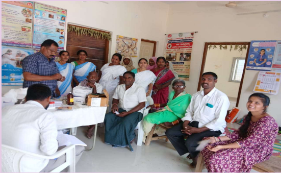
ధారుర్ మర్చి 28(ప్రజా జ్యోతి)