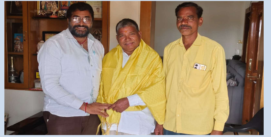
మొయినాబాద్ మార్చి 25 ( ప్రజా జ్యోతి)

- టీడీపీ జాతీయ అధికార ప్రతినిధి, రాష్ట్ర పాలిట్యూరో సభ్యుడు బక్కని నర్సింహూలు..