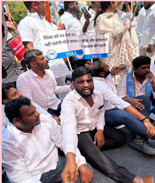
కూకట్ పల్లి, మార్చి 25 (ప్రజా జ్యోతి) :