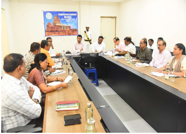
గద్వాల మార్చి 25 (ప్రజా జ్యోతి ప్రతినది):