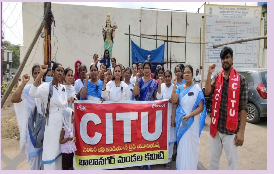
బాలానగర్, మార్చి 25 (ప్రజా జ్యోతి) :