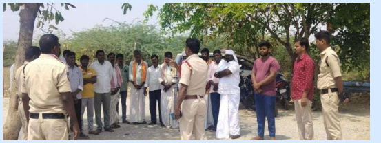
మఖల్ నియోజకవర్గ ప్రతినది మార్చి 25 (ప్రజా జ్యోతి):