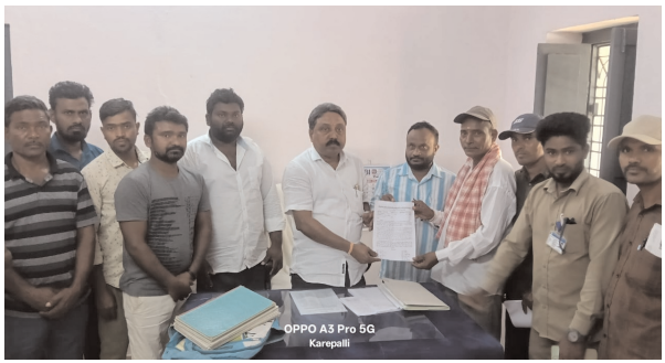
వేతనాలు అందని పరిస్థితి ఏర్పడిందన్నారు. పంచాయతీల అకౌంట్ నుండి వేతనాలు చెల్లించేందుకు వీలవ్వకుండా పంచాయతీల బ్యాంక్ ఖాతాలను ఫ్రీజ్ చేయడం వల్ల కార్మికులు ఆర్థిక ఇబ్బందులను ఎదుర్కొంటున్నారు. సమస్యలను రాష్ట్ర ప్రభుత్వం దృష్టికి తీసుకెళ్లి రాష్ట్ర బడ్జెట్ సమావేశాల సందర్భంగా కార్మికుల వేతనాలకు బడ్జెట్ కేటాయింపులని, ఎన్సీఓలలో నిలిచిపోయిన వేతనాల బిల్లులను రిలీజ్ చేయించాలని, పంచాయతీల బ్యాంక్ ఖాతాల ఫ్రీజింగ్ను ఎత్తివేయాలని, కార్మికులకు తక్షణమే వేతనాలు అందే విధంగా చర్యలు తీసుకోవాలని కోరారు.

ఎండల తీవ్రత పెరుగుతున్న నేపథ్యంలో కార్మికుల భద్రతను దృష్టిలో పెట్టుకొని ఒకపూట పని కల్పించాలని, జీపి కార్మికులకు ప్రభుత్వం నుంచి అందవలసిన వేతనాలను విడుదల చేసి, వారి డిమాండ్లను పరిష్కరించాలని శుక్రవారం సింగరేణి మండల జీపి కార్మికులు మండల ఎంపీ ఓ.ఎం. రవీంద్రప్రసాద్ కు వినతిపత్రం అందజేశారు. ఈ సందర్భంగా సిబిఐయి మండల కార్యదర్శి నరేంద్ర మాట్లాడుతూ... తెలంగాణ రాష్ట్రవ్యాప్తంగా 12769 గ్రామ పంచాయతీలలో వివిధ రకాల పారిశుధ్య పనులు చేస్తూ గ్రామీణ ప్రాంతాలలోని ప్రజలకు సేవలందిస్తున్న పంచాయతీ కార్మికుల శ్రమను గుర్తుంచి ప్రభుత్వ ఉద్యోగుల వలె గ్రీన్ ఛానల్ ద్వారా నేరుగా కార్మికులకు వేతనాలు చెల్లిస్తామని రాష్ట్ర ప్రభుత్వం ప్రతిష్టాత్మకమైన ప్రకటన చేయడంతో పంచాయతీ కార్మికుల కుటుంబాలలో అనందోత్సాహాన్ని నింపింది, కానీ ఇప్పటివరకు ఆ ప్రకటన అమలు పరచలేదని అన్నారు. 2 నెలలు గడుస్తున్నప్పటికీ ప్రభుత్వం ఇచ్చిన హామీ అమలు కాకపోవడంతో కార్మికులు నిరాశకు గురౌతున్నారన్నారు. తక్షణం ప్రభుత్వం ఇచ్చిన హామీ ప్రకారం వేతనాలు చెల్లించాలని, పంచాయతీ సిబ్బంది బకాయి వేతనాల చెల్లింపుకై రాష్ట్ర ప్రభుత్వం 2025 జనవరి 18న రూ. 149 కోట్లను విడుదల చేసింది. ఆ మేరకు అన్ని జిల్లాలకు నిధులు విడుదల చేయడం జరిగింది కానీ పంచాయతీల నుండి పంపిన చెక్కులు ఎసిటీఓలలో నిలిచిపోయి కార్మికులకు