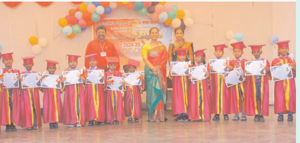
ఖమ్మం ప్రతినిధి ప్రజా జ్యోతి