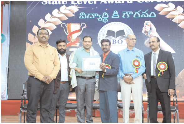
ఖమ్మం ప్రతినిధి ప్రజా జ్యోతి