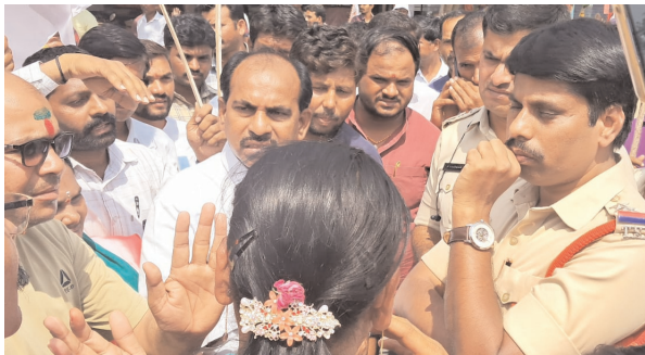
కారేపల్లి, మార్చి 04, ప్రజా జ్యోతి:

సేవాలాల్ ఫోటో దిమ్మెను తొలగించిన వారిపై చర్యలు తీసుకోవాలి యధా స్థానంలో సీత భవానిలు ఏర్పాటు మండల బంజారా గిరిజన సంఘ నాయకులు