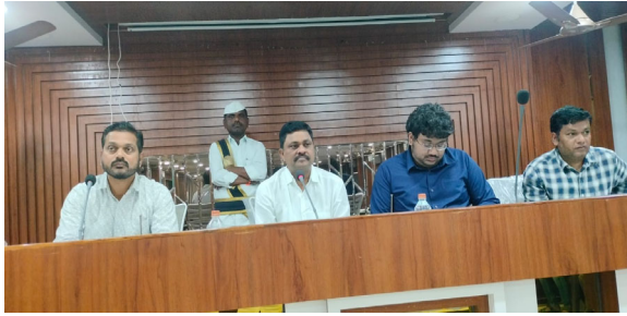
రేషన్ షాపులకు బియ్యం సరఫరా యధాతతం :