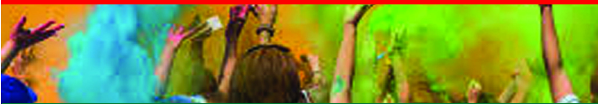
-నేడు హెలీ పండుగ -రంగుల కొనుగోళ్లతో దుకాణాల వద్ద సందడి -సహజరంగులు వినియోగించాలని పర్యావరణవేత్తల సూచన -పలుచోట్ల కామ దహనాలు