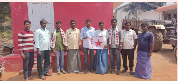
మునగాల మార్చి 9 ప్రజా జ్యోతి):