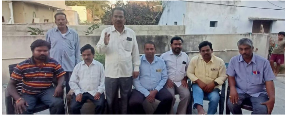
రామన్నపేట మార్చి 5 ప్రజా జ్యోతి తెలంగాణ ఉద్యమకారులకు తక్షణమే రాష్ట్ర ప్రభుత్వం సంక్షేమ బోర్డు ఏర్పాటు చేయాలని రేపు జరిగే అసెంబ్లీ సమావేశాల్లో