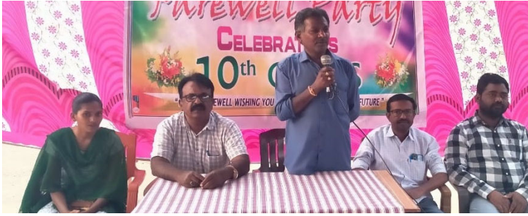
తుంగతుర్తి, మార్చి 4, (ప్రజా జ్యోతి) చిరునవ్వులతో సాగే బాల్యం అందరి జీవితంలో ఎంతో విలువైన సమయమని, మనలో అందరికీ చిన్నప్పటి పాఠశాల, క్లాస్ రూమ్ లోకి సంబంధించి ఎన్నో మధురాసభాతులు ఉంటాయని శ్రీ విద్యా