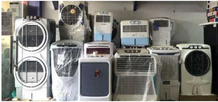
ఎక్కువగా ఉండడంతో అధిక మొత్తంలో స్టాక్ అందుబాటులో ఉంచారు. చుట్టుపక్కల గ్రామాల నుంచి వచ్చే కస్టమర్ల కోసం డోర్ డెలివరీ సౌకర్యాన్ని అందుబాటులో ఉంచినట్లు వారు తెలిపారు

నిడమనూరు, మార్చి 04 (ప్రజాజ్యోతి): ఈసారి వేసవి కాలం కంటే ముందే ఎండలు ముదిరాయి. సామాన్యంగా ఏప్రిల్ నుంచి ఎండ తీవ్రత పెరగాల్సి ఉండగా.. అంతకముందే ఫిబ్రవరి చివరి వారం నుంచి పెరుగుతూ వస్తుంది. మార్చి మొదటి వారంలోనే 38 డిగ్రీల తీవ్రత ఉండటంతో ప్రజలు ఉక్కుపోతతో సతమతమవుతున్నారు.. ఉక్కుపోత నుంచి రక్షణకు కూలర్లను కొనుగోలు చేస్తున్నారు. దీంతో కూలర్లకు గిరాకీ పెరిగింది. వివిధ మోడల్లలో పలువురు వ్యాపారులు కూలర్లను అందుబాటులోకి తీసుకొచ్చారు. వీటితో చల్లదీ నీటి కోసం కుండలు, ప్రిడ్జ్ పాటు ఏసీలను కొనుగోలు చేస్తున్నారు. -వేసవికాలం రాగానే మనందరికీ గుర్తొచ్చేవి ఫ్రిడ్జ్, కూలర్లు... వేసవికాలం రాగానే మనందరికీ గుర్తొచ్చేవి ఫ్రిడ్జ్, కూలర్లు.ఎండ నుంచి రక్షణకు, వేసవి తాపానికి ప్రతి ఇంట్లో ఇవి దర్శనమిస్తుంటాయి. వేసవికాలం వస్తున్న సందర్భంలో మండలంలో ఫ్రిడ్జ్ కూలర్ ల విక్రయాలు జోరందుకున్నాయి. ఎండాకాలం దృష్ట్యా ఉక్కుపోత నుంచి రక్షణ పొందేందుకు ఇప్పటినుంచి వీటి చూపుతున్నారు. దీంతో మండలంలోని పలు ఎలక్ట్రానిక్ దుకాణాలలో ఇప్పటికే వ్యాపారస్థులు సరికొత్త మోడల్లలో కూలర్లను ఫ్రిడ్జ్ ను అందుబాటులో ఉంచారు. మధ్య తరగతి వారికి సైతం ధరలు అందుబాటులో ఉండే విధంగా వ్యాపారస్థులు వివిధ వెర్షన్లలో విక్రయానికి సిద్ధమయ్యారు. వీటి ధర మోడల్ ని బట్టి రూ 2 వేల నుంచి 25 వేల వరకు ఉన్నట్లు సమాచారం. ఎండాకాలంలో వీటి డిమాండ్