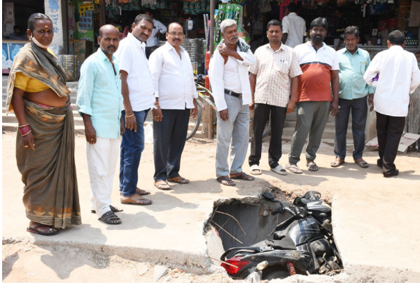
చౌటుప్పల్ మార్చి 27 (ప్రజా జ్యోతి) అండర్ గ్రౌండ్ డ్రైనేజీలో ద్వితీయ వాహనము పడి వాహనదారునికి గాయాలైన ఘటన చౌటుప్పల్ మున్సిపాలిటీలో గురువారం చోటుచేసుకుంది.స్థానికులు తెలిపిన వివరాలు ప్రకారం..కిరాణి

- నాసిరకం నిర్మాణాలతో ఇబ్బంది పడుతున్న ప్రజలు, దుకాణదారులు