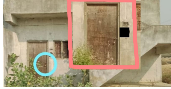
మోతా మార్చి 27 (ప్రజా జ్యోతి): గత తెలంగాణ రాష్ట్ర ప్రభుత్వం ఎంతో ప్రతిష్టాత్మకంగా చేపట్టిన డబల్ బెడ్ రూమ్ ఇండ్లను మోతా మండల కేంద్రం లో అప్పుడు ఉన్న గ్రామ సర్పంచ్ చొరవ కూడా లేకుండా అధికారం ఉందని

డబల్ బెడ్ రూమ్ ఇండ్లలో అవకతవకలు..... ఇంటికి తాళం ఇల్లుకు బేరం...!! ఇల్లు ఉన్నవాళ్లకి ఇల్లు ఇవ్వడంతో తాళాలు తీయక పడబడ్డ ఇండ్లు.....!! పట్టించుకోని ప్రస్తుత ప్రభుత్వ అధికారులు.....!! స్థానిక మంత్రి కలగ చేసుకొని అనర్వులను తొలగించి అర్వులకు ఇండ్లు కేటాయించాలని గ్రామస్థులు కోరుకుంటున్నారు ....!!