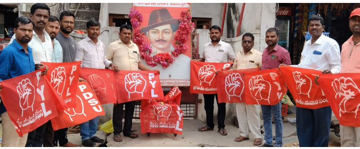
ఆలేరు, మార్చి 23(ప్రజాజ్యోతి): భారత దేశ స్వాతంత్ర్య పోరాటంలో అసాధారణ ధైర్యంతో పోరాడిన విప్లవ యువకిశోరులు షహీద్ భగత్ సింగ్,

- రాజ్ గురు భగత్ సింగ్ చిత్రపటాలకు నివాళులు అర్పిస్తున్న నాయకులు