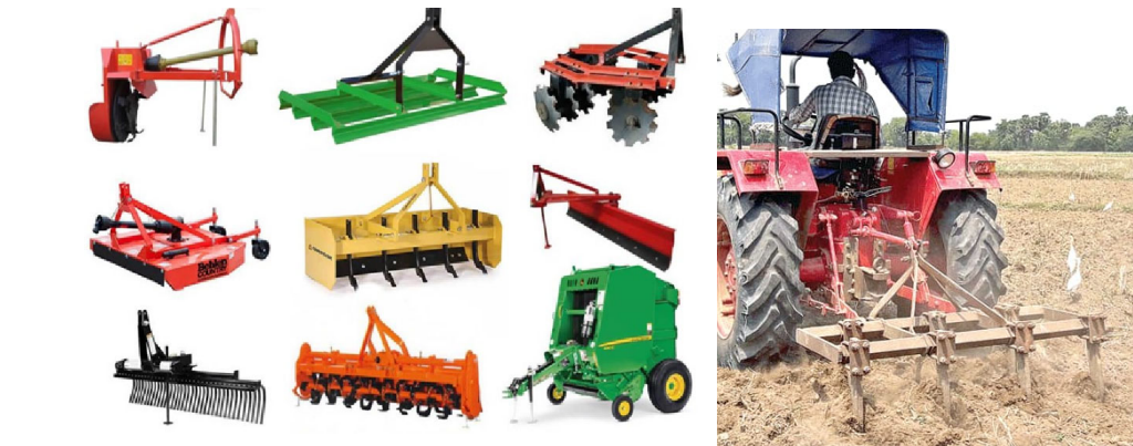
యంత్రాల కోసం రైతులు ఎదురు చూస్తున్నారు.

నిడమనూరు, మార్చి 23(ప్రజాజ్యోతి): పెట్రోలు, డీజిల్ రేట్లు పెరిగిపోవడంతో వ్యవసాయ యంత్రాలకు అద్దెలు కూడా పెరిగిపోయాయి. దీంతో రైతులు చాలా అవస్థలు పడుతున్నారు. పంటపై పెట్టిన పెట్టుబడి రాక రైతులు అప్పుల పాలవుతున్నారు. రైతులకు ఎంతో ఉపయోగకరమైన పనిముట్లను సబ్సిడీపై ప్రభుత్వం అందిస్తూ ఉండేది. కానీ 2018 నుంచి సబ్సిడీ పరికరాలను పంపిణీ చేయడంలేదు. ప్రభుత్వం నుంచి నిధులు రాక ఇవ్వడం లేదా..లేక అధికారుల నిర్లక్ష్యమా అనే విషయం అర్థంకాక రైతులు అయోమయంలో ఉన్నారు. రైతులకు అవసరమైన వ్యవసాయ పనిముట్లు 33 శాతం సబ్సిడీలో ప్రభుత్వం నుంచి పొంది సబ్సిడీనియోగం చేసుకునేవారు. కానీ 2018 నుంచి వ్యవసాయ శాఖ నుంచి వాటిని నిలిపివేశారు. -అందాల్సిన సామగ్రి.. పంటలకు క్రిమి సంహారక మందుల పిచికారీ చేసేందుకు పంపులను పంపిణీ చేశారు.కాని ట్రాక్టర్లు ఉపయోగించే నాగళ్లు, డిస్కురోటోవేటర్లు,గొర్రులు, నాటు వేసే యంత్రాలు, వరి పంట నూర్పిడి యంత్రాలు, డ్రమ్ సీడర్లు, ఇతర ఆధునిక