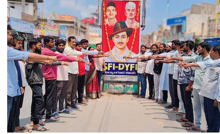
మిర్యాలగూడ, మార్చి 23, ( ప్రజాజ్యోతి ): మతోన్మాద శక్తులకు వ్యతిరేకంగా పోరాటమే భగత్ సింగ్ కి ఇచ్చే నిజమైన నివాళి అని , యువత ప్రపంచాన్ని