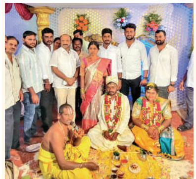
ఆత్మకూరు, మార్చి 6