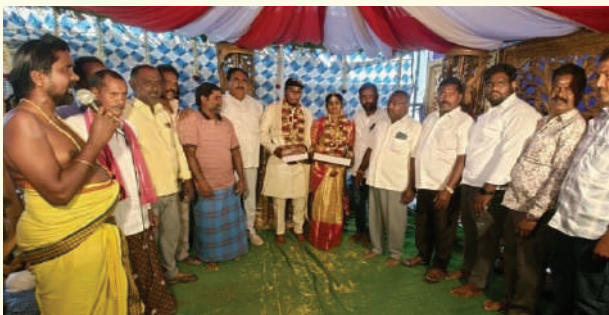
రాయపర్తి, మార్చి, 6 (ప్రజాజ్యోతి):