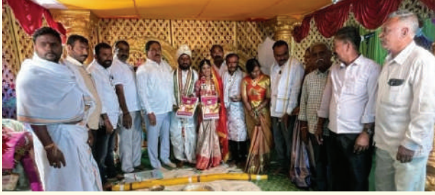
రాయపర్తి, మార్చి, 6 (ప్రజాజ్యోతి):