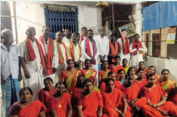
గణపూరం మార్చి, 6(ప్రజాజ్యోతి):