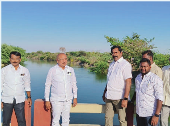
పర్యవేక్షణ, మార్చి, 6 (ప్రజాజ్యోతి):