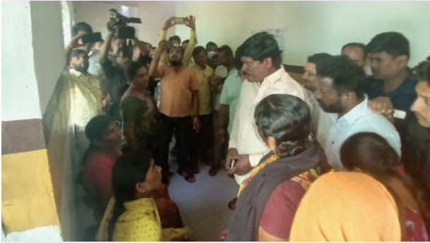
నర్సంపేట/మార్చి 06 (ప్రజాజ్యోతి):