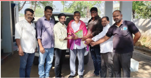
మరిపెడ, మార్చి, 6(ప్రజాజ్యోతి):