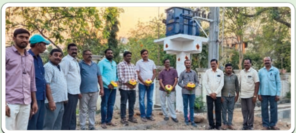
భద్రాచలం, మార్చి 6 (ప్రజాజ్యోతి):