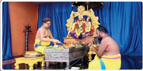
భద్రాచలం, మార్చి 6 (ప్రజాజ్యోతి):

భద్రాచలం దివ్యక్షేత్రంలోని బేదా మండపంలో అర్చకులు గురువారం స్వామివారికి నిత్యకల్యాణం నిర్వహించారు. తెల్లవారుజామున ఆలయ తలుపులు తెరిచి స్వామివారికి సుప్రభాతం పలికి ఆరాధన, ఆరగింపు, సేవాకాలం, నిత్యహోమాలు, నిత్యబలిహరణ, నిత్యపూజలు జరిపారు కల్యాణంలో పాల్గొన్న దాతలకు ప్రసాదాలు, శేషవస్త్రాలు అందజేశారు. ఈ కార్యక్రమంలో అర్చకులు, ఆలయ సిబ్బంది పాల్గొన్నారు.