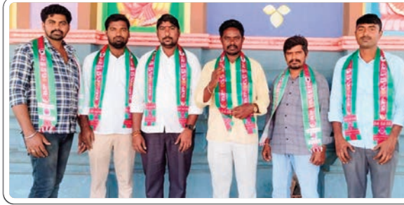
బేకులపల్లి, మార్చి 06, ప్రజాజ్యోతి:

మద్యం అధిక ధరలపై చర్యలు చేపట్టాలి - సేవాలాల్ సేన