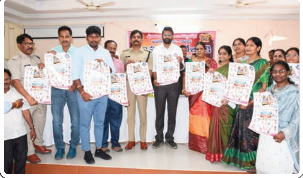
భద్రాచలం, మార్చి 6 (ప్రజాజ్యోతి):