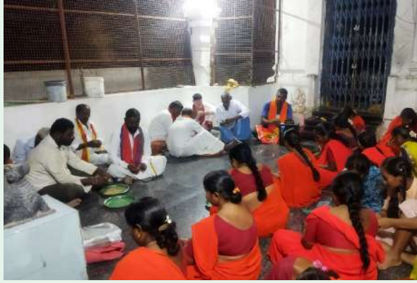
గణపురం మార్చి 04 (ప్రజాజ్యోతి):