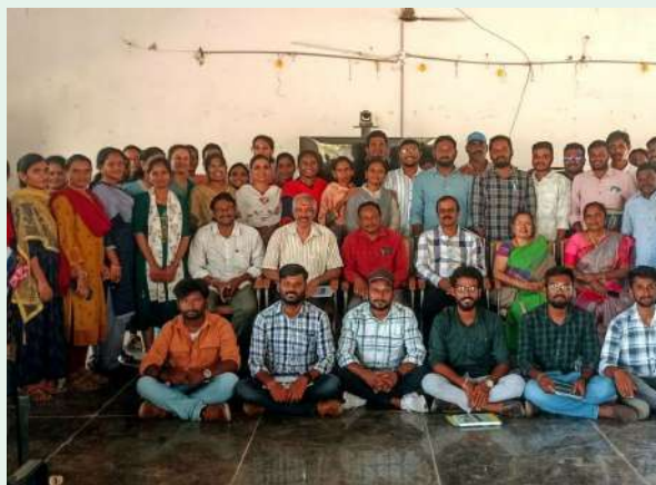
గణపురం ప్రజాజ్యోతి మార్చి 04