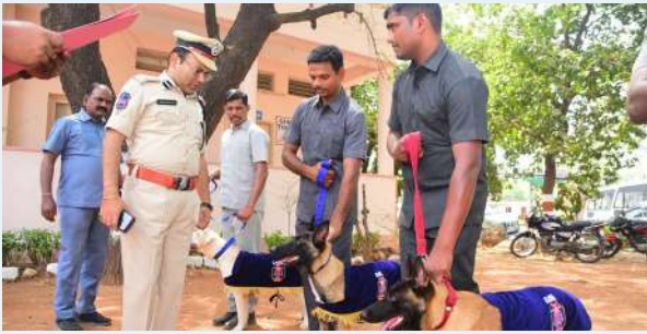
హనుమకొండ జిల్లా ప్రతినిధి : మార్చి 04, ప్రజా జ్యోతి